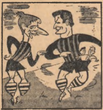
DUMITRIU II: — Ionescu, trebuie să ne pregătim buzurarele acum pentru elevienți!