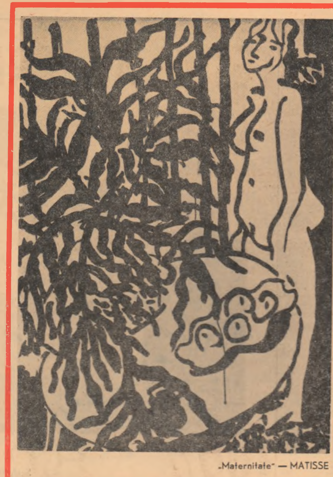
„Maternitate” — MATISSE