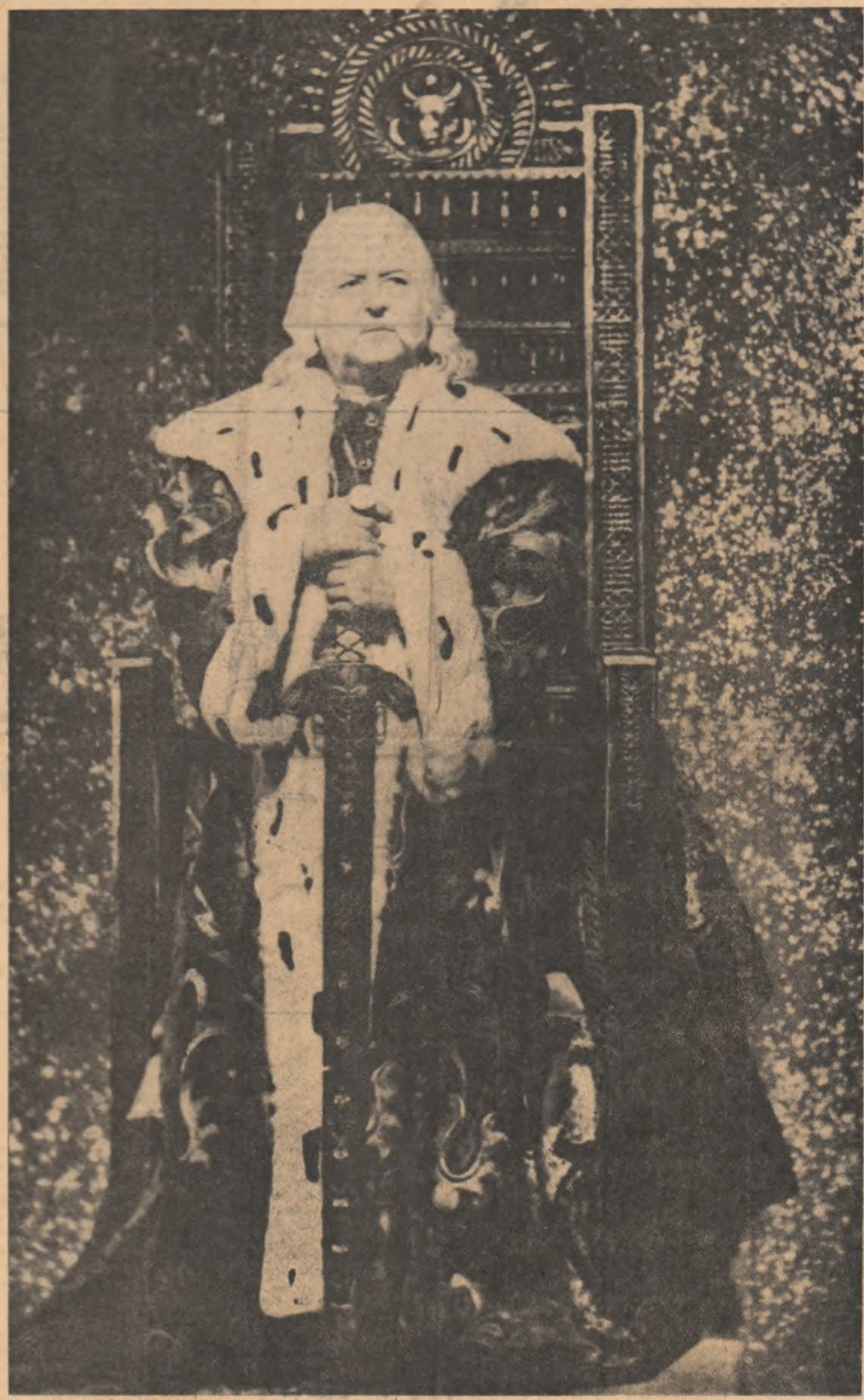
Astăseară Teatrul Național I. B. Caragiale inaugurează noua stagiune cu capodopera lui Barbu Ștefănescu Delavrancea „Apus de Soare”. În rolul Voievodului Ștefan: artistul poporului George Calboreanu.