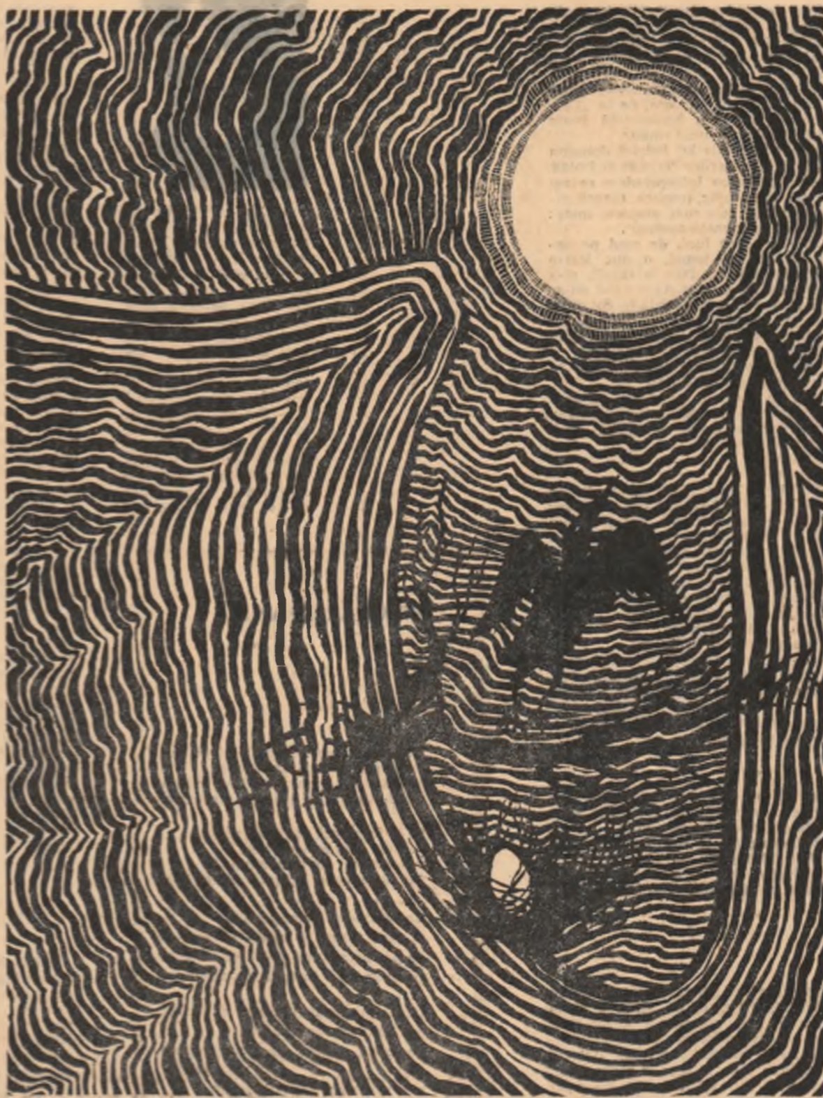
Desen de FLORIN PUCA

Am fost primit imediat. — Domnule prefect, o trupă de teatru din București, în frunte cu Ion Manolescu, cel mai mare artist al nostru... etc. etc... primul turneu românesc în Ardealul des-