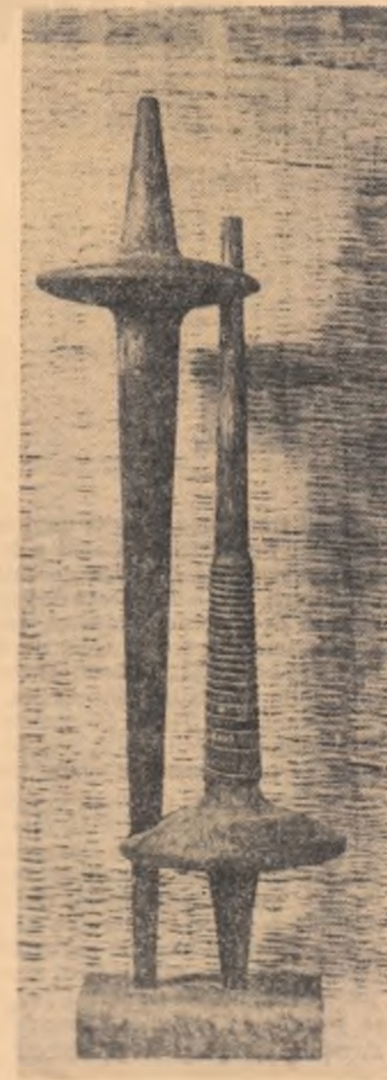
„Pereche de țesut” (fîră vieții) de LAURENTIU MIHAIL

Mi s-a spus să stau nemiscat. Stau nemiscat, cu capul negru oprimat de adevăruri. As fi ucis, dac-as clinti perdeaua. Nu o clintesc. Orice mișcare trădează, orice mișcare dărimă o lume, iar eu nu-s destul de puternic, n-am dreptul - din desnădejdea mea mijlocie nu voi putea să clădesc alta-n loc. Doamne, Hamlet.