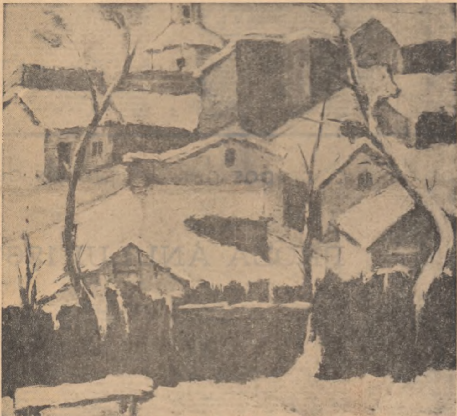
„Peisaj ișjean de iarnă” de NECULAI POPA