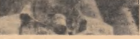
Aviator VASILE DUMITRACHE

(electroceramist la Turda, nu simplu artizan ocupat doar cu plămădirea oalelor și-a cănilor de argilă). A trecut de-o dovedească și reportajul, bucuros că și-a regăsit eroul după 2000 de zile, la fel de bucuros ca atunci cînd regăsește, după 2000 de ani, de fiecare dată, obiectul din lut care-și păstrează, neștirbit, încăpătînat, liniile existenței sale vestică. La înalta tensiune la care trăim, amintirile, anii, destinele, semnificațiile se interfează.