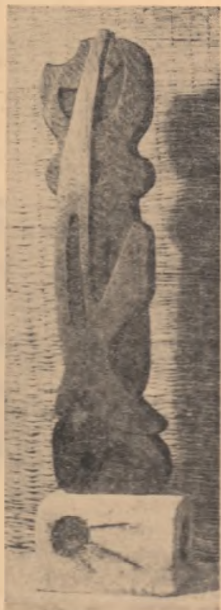
Secolul XX - sculptură de LAURENTIU MIHAIL

Vai acelora pentru care părăsirea nu se împlineste! Gurile se vor atinge de atîta durere, Păsările își vor lipi aripile de tăcerea voastră noaptea.