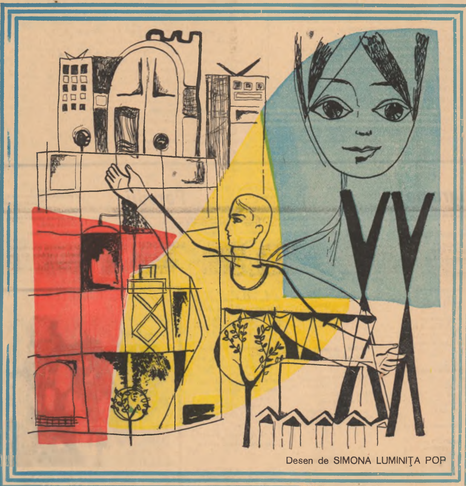
Desen de SIMONA LUMINIȚA POP

Cald în pădurea pieptănului aruncat, în munții gresiei unde se arată,