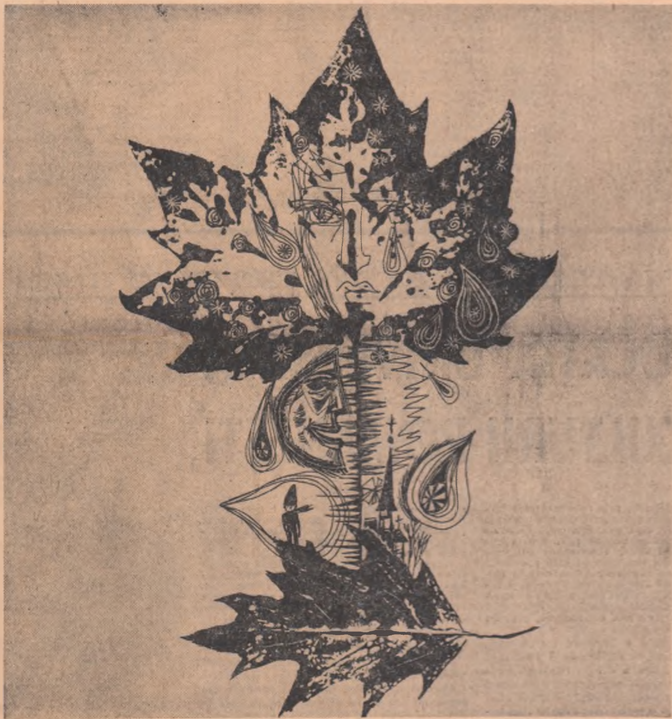
Desen de MIHU VULCĂNESCU

SĂPTĂMÎNAL AL UNIUNII SCRITORILOR DIN REPUBLICA SOCIALISTĂ ROMÂNIA ANUL XI — Nr. 7 (303) ● Redactor-șef EUGEN BARBU ● Simbătă 17 FEBRUARIE 1968