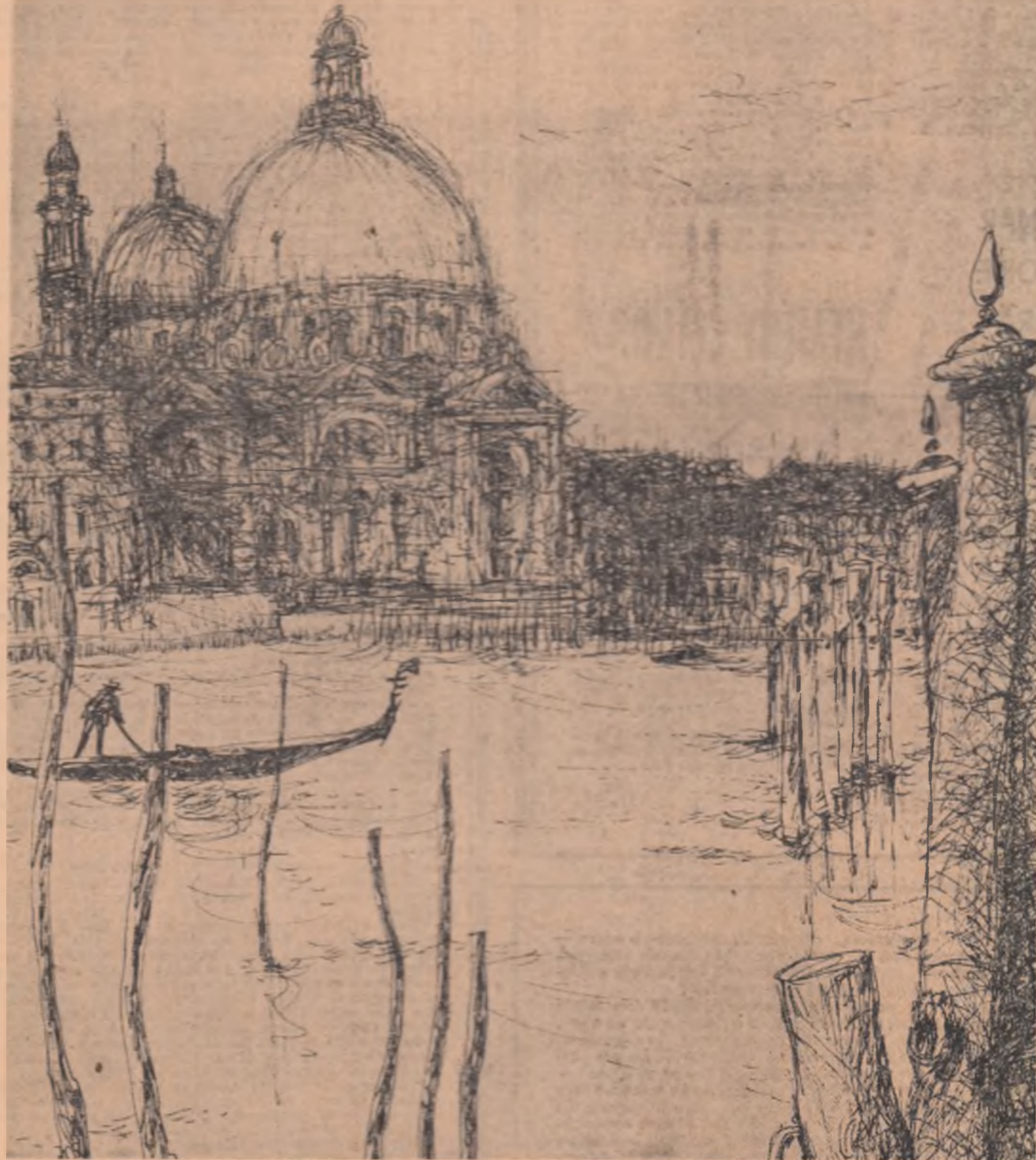
MIHU VULCĂNESCU — Veneția