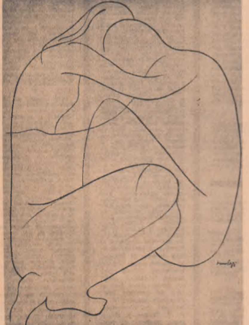
Desen de SIMONA LUMINIȚA POP