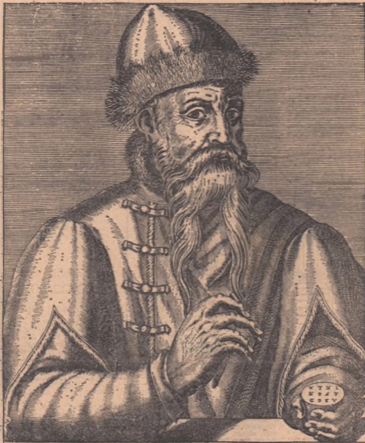
Desen de A. THEVET, 1584 500 DE ANI DE LA MOARTEA LUI JOHANES GUTENBERG (În paginile revistei gravuri din epoca tiparului lui Gutenberg)