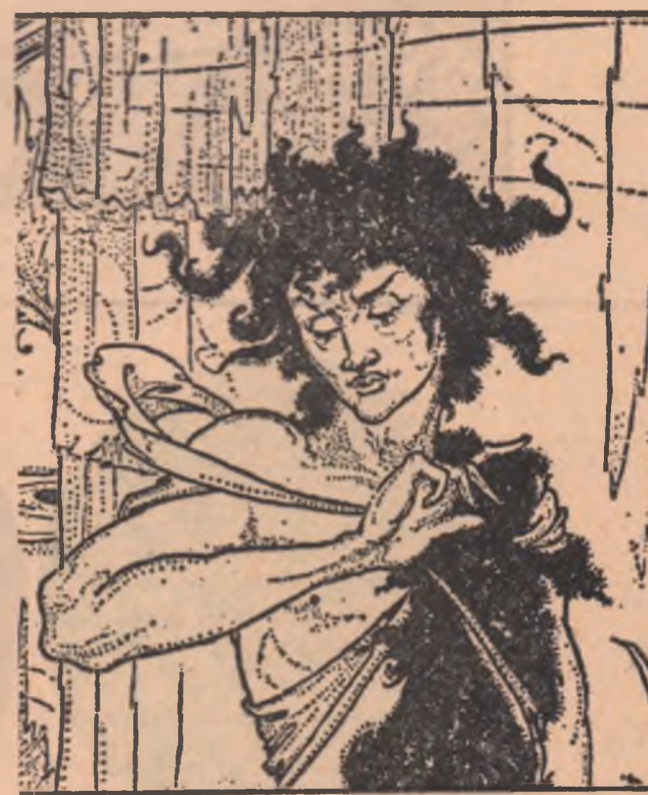
AUBREY BEARDSLEY SIEGFRIED (detaliu)

de-abre au flacăra împietrită, apa în bazin e tare iar p-educurile flintinii au rămas în aer.