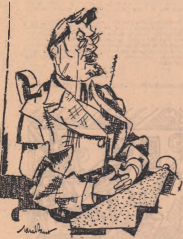
desen de MARCEL IANCU

unitatea și pe planul gândirii estetice, îngrădit fiind de un cîmp de valabilitate (clasic) care nea realitatea contradicției (și care implicit nu-i putea da nici o sugereție rațională).