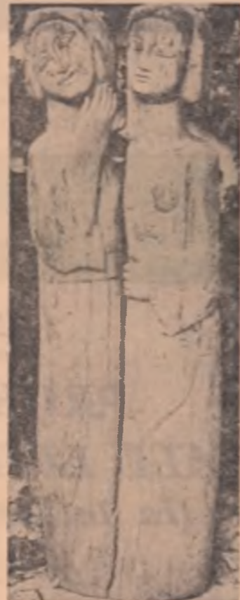
Sculptură de GEORGE APOSTU

Debutul în revistă: Ateneu 1967. Apoi colaborează la Cronica, Lucașfăru. Debutul editorial probabil: trimestrul I 1969, Editura pentru literatură. Redactor de carte: Lucian Cursaru. Opinia redactorului de carte despre debut: „Romanul, subtilizat, de o autenticitate riscătoare”. Titlul cărții: MINCIUNA ROMÂNĂ.