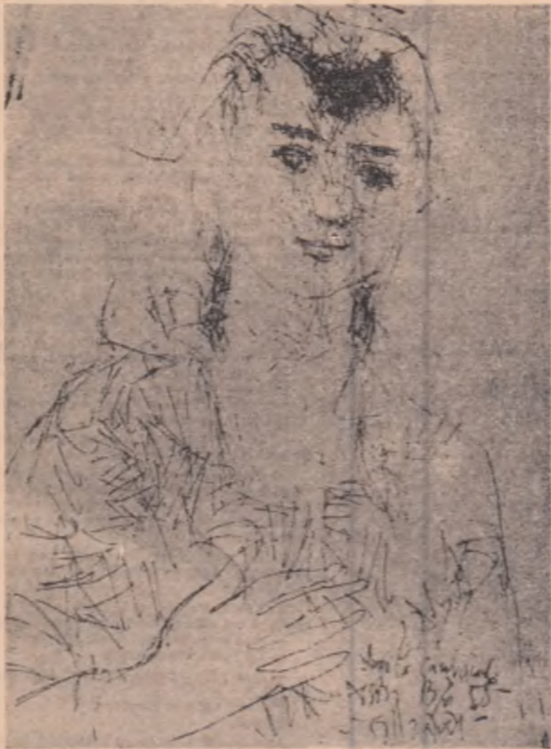
Desen de EUGEN DRAGUȚESCU

Leonid Dimov, poet al contemplației, dar nu cu ochiul fixat asupra unui punct din univers, ci ochiul devenind un centru în jurul căruia se rotește luminile iluzorii, într-o succesiune arbitrară a regnurilor, o interferare a acestor regnuri, fără nici o regulă, dar plină de armonie. Din ce rezultă această coeziune a fragmentelor îmbrățișate în vîrteja hazardului pur, acesta revellîndu-se ca lege supremă a poeziei lui Dimov? Frapantă, imediat, se dovedește prezența absentei oricărei preocupări de perspectivă, de adăncire a ceea ce ni se desfășoară înainte ca un covor fermecat, beat de seducții polierome de asociații voluptuoase care triumfă într-o bucurie nebulă de a fi înregistra-