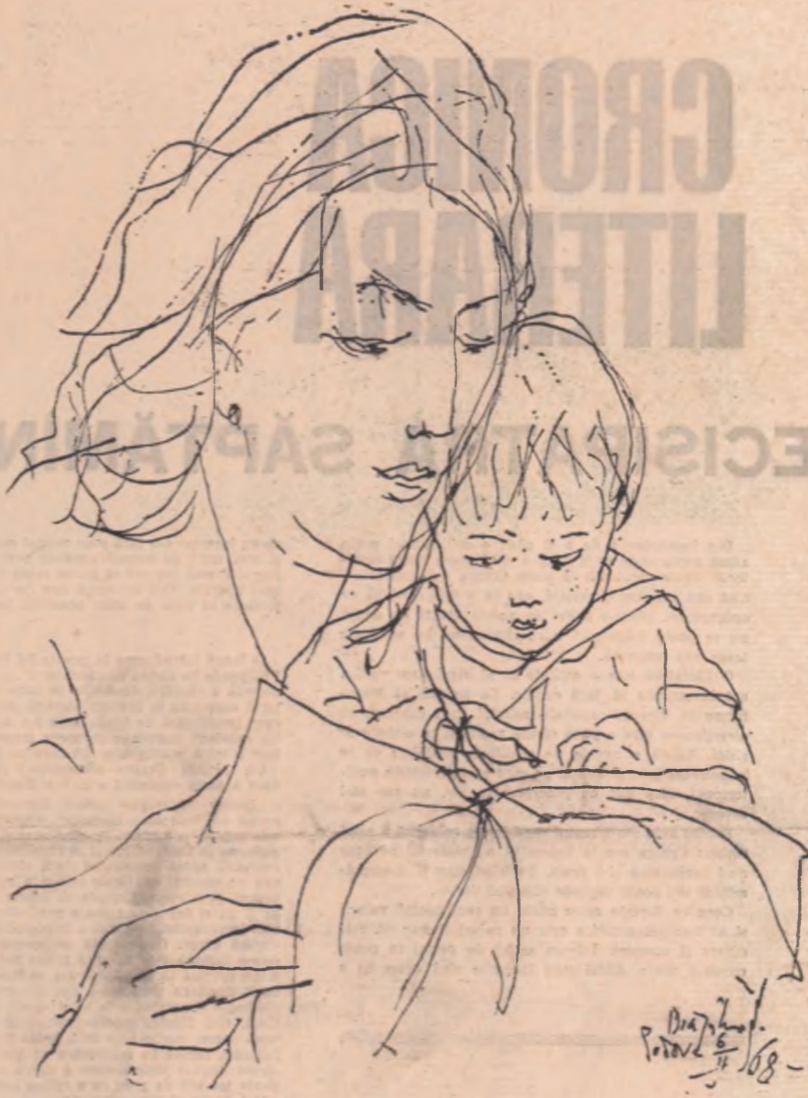
Desen de EUGEN DRAGUȚESCU