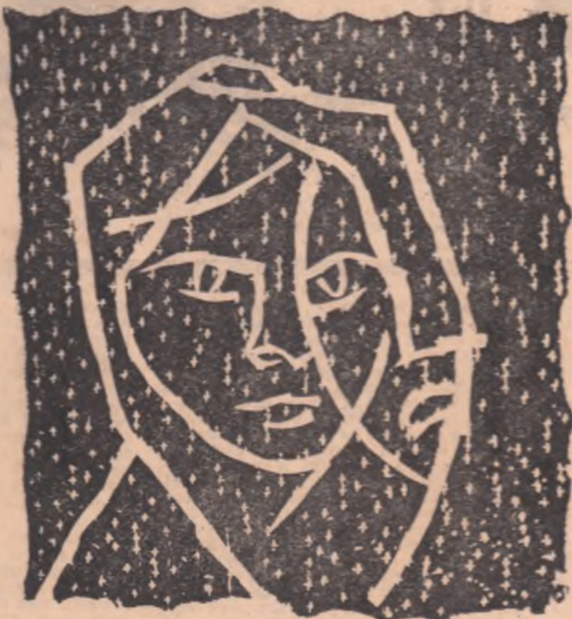
Ilustrație de KAREL SVOLINSKY