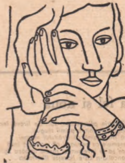
Desen de FERNAND LEGER