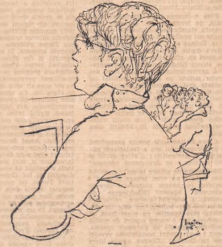
Desen de EUGEN DRAGUȚESCU

- Da-n sfîrșit, au trecut anii, el a ieșit la lumină, l-au furtat cine trebuia să-l ierte, scootînd că și-a ispășit singur pedeapsa care i se cădea pentru substragere, numai că Bașag al meu nu și-o văzut de treabă. Mă cam împiedicam de el, în poartă la a mea, că și pe ea tot Maria o cheamă - și într-o seară, m-am hotărî să pun capăt. Mare lucru nu i-am făcut eu, l-am stors numai niște singe din nas, da mi ș-o dus vestea.