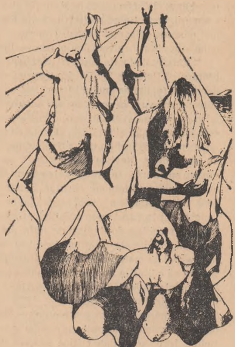
Desen de TAȘCU GHEORGHIU