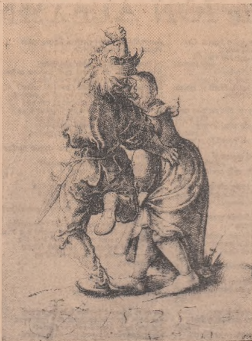
Urs Graf (1486-1553) — Dans

Destinsă încordarea pecetluește saltul Spre alte continente de fum pierzînd sandaua Cînd creierul metodic și-a ascuțit rindeaua Pe oasele din mine. Pentru altul.