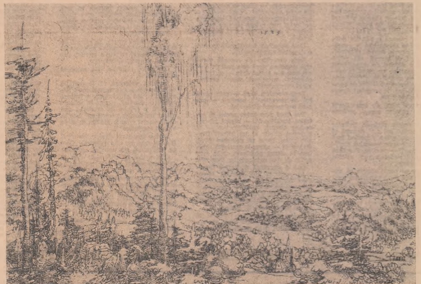
Wolf Hubs (1502—1540) — Peisaj

Se scurseseră multe zile de la această întimplare ciudată. De-atunci, Bulf nu mai plecase niciodată singur: nici în Cotul cu Minărtăga, nici în Cotul lui Gîngă, în nici o sită parte. În ziua următoare întimplării, Bulf, sosise pe imasul înverzit al Țărșului, cu aproape o oră în urmă celorlalți. Dorise să-i prindă pe toți. Și totuși rămăseseră uimiți, văzîndu-l cum, fără a se mai uita spre poienita lui preferată, o apucase drept spre el. Unul din ei strigase cît îl ținea gura: „Băieți, priviți! Vine Bulf, vine Bulf!” Se apropiase de el, și, sfîșos, le spusese: — „Bună dimineața”.