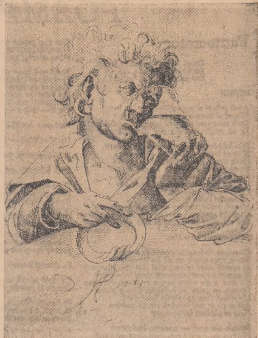
Jost Amman (1539-1592)