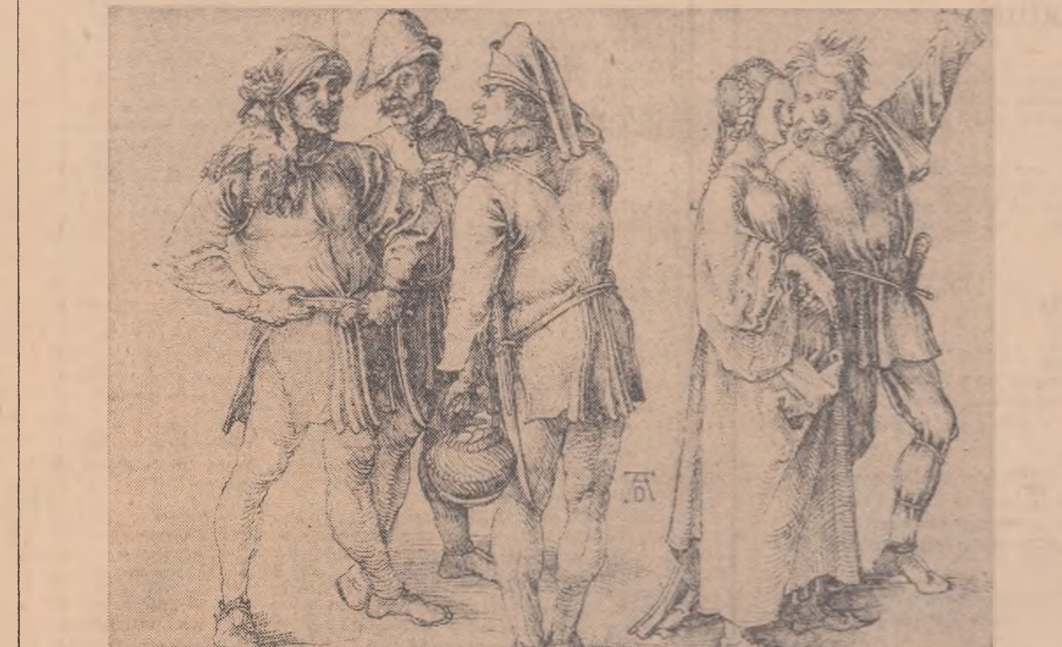
Dürer — Jörani