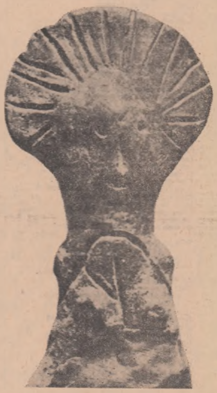
Statuetă din cultura Vinca-Turdaș

Atunci se apropie de el, un altul, mai tînăr, probabil prieten, își trase un scaun și se așeză și el. În viora celuilalt pe limba lor, și ridea scurt, îl strălucia gura de alita aur, dinții de aur, și avea un inel cu piatră galbenă cit o nucă.