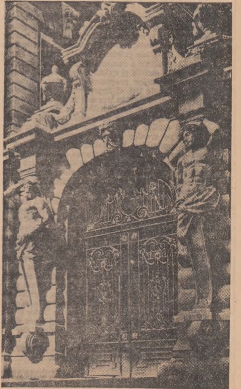
Portal în Strada Colonalilor