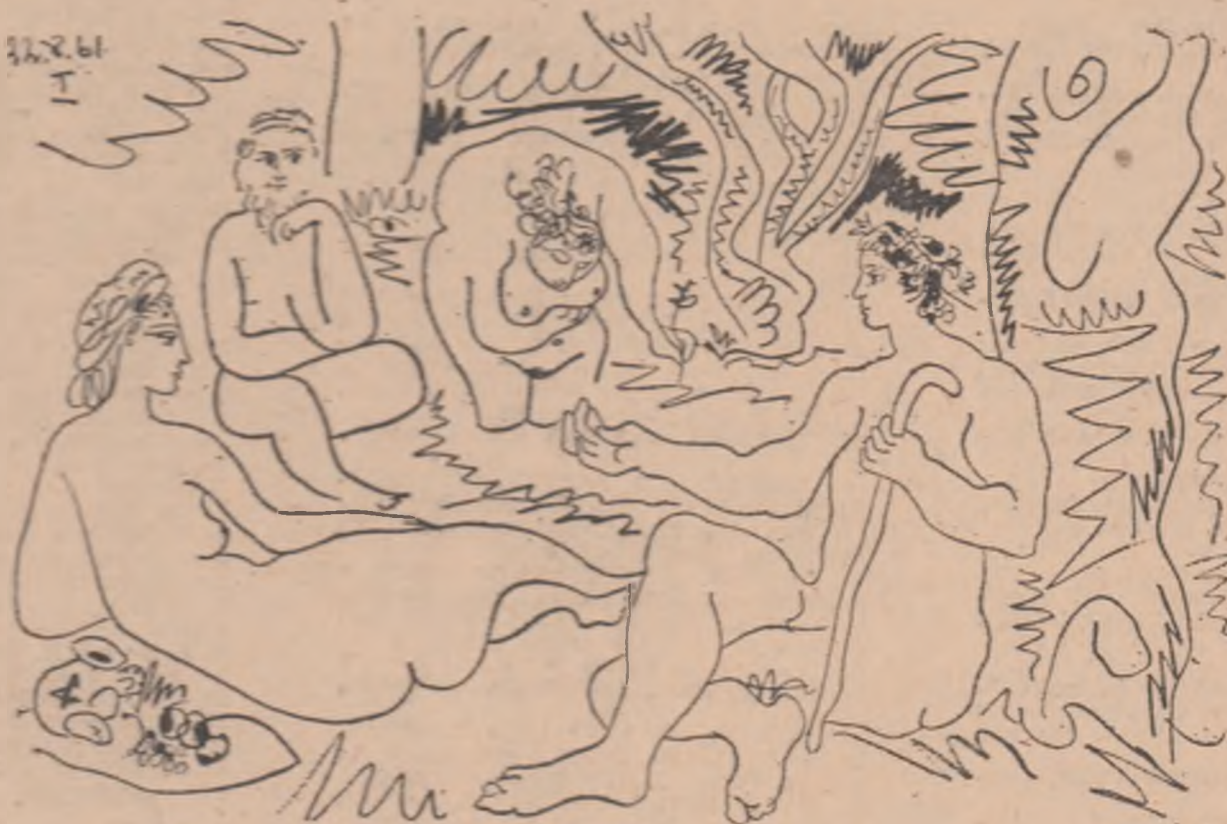
Desen de PICASSO

Va fi un timp cînd voi primi ușor Ca pe nimic, cu prîț de îndoială, Să merg fără lumină ca un nor Nepăsător de propria-năvală. Va fi un timp mai dulce decît toți, Și decît ochii sfinților mai sfinți, Cînd tu sau eu, o, cine știe cînd Ne vom supune infernalei morți. Ce fum va curge, ce sperare mare Va-nmiresma iertînd tîmii de brad, Trupul întreg vînd recuperare, Sîngele tot zbatut în aiurare, Nervii destînsi în astenii amare, Vocea gustînd finul cu oroare, Instinctul revoltat. Recuperare.