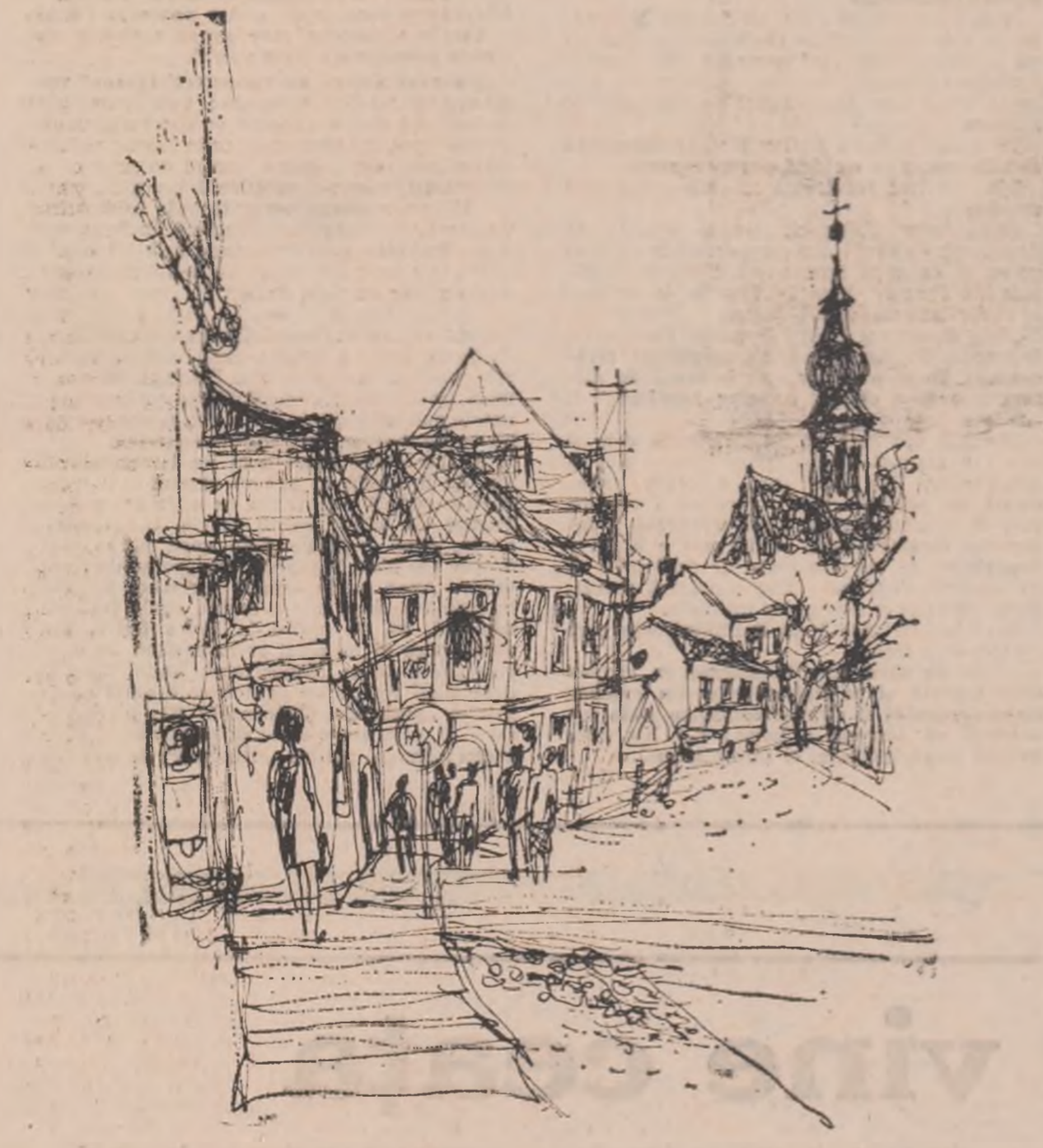
Desene de MIHU VULCANESCU