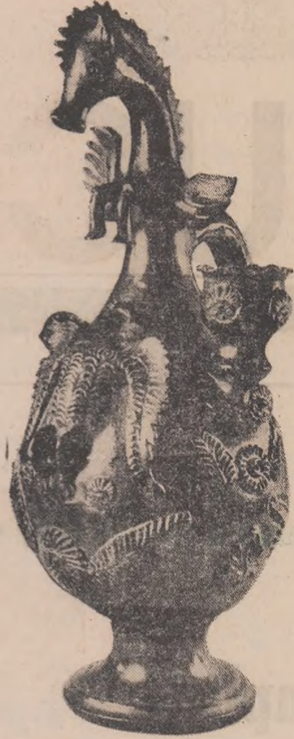
Ulcior de nuntă din Curtea de Argeș