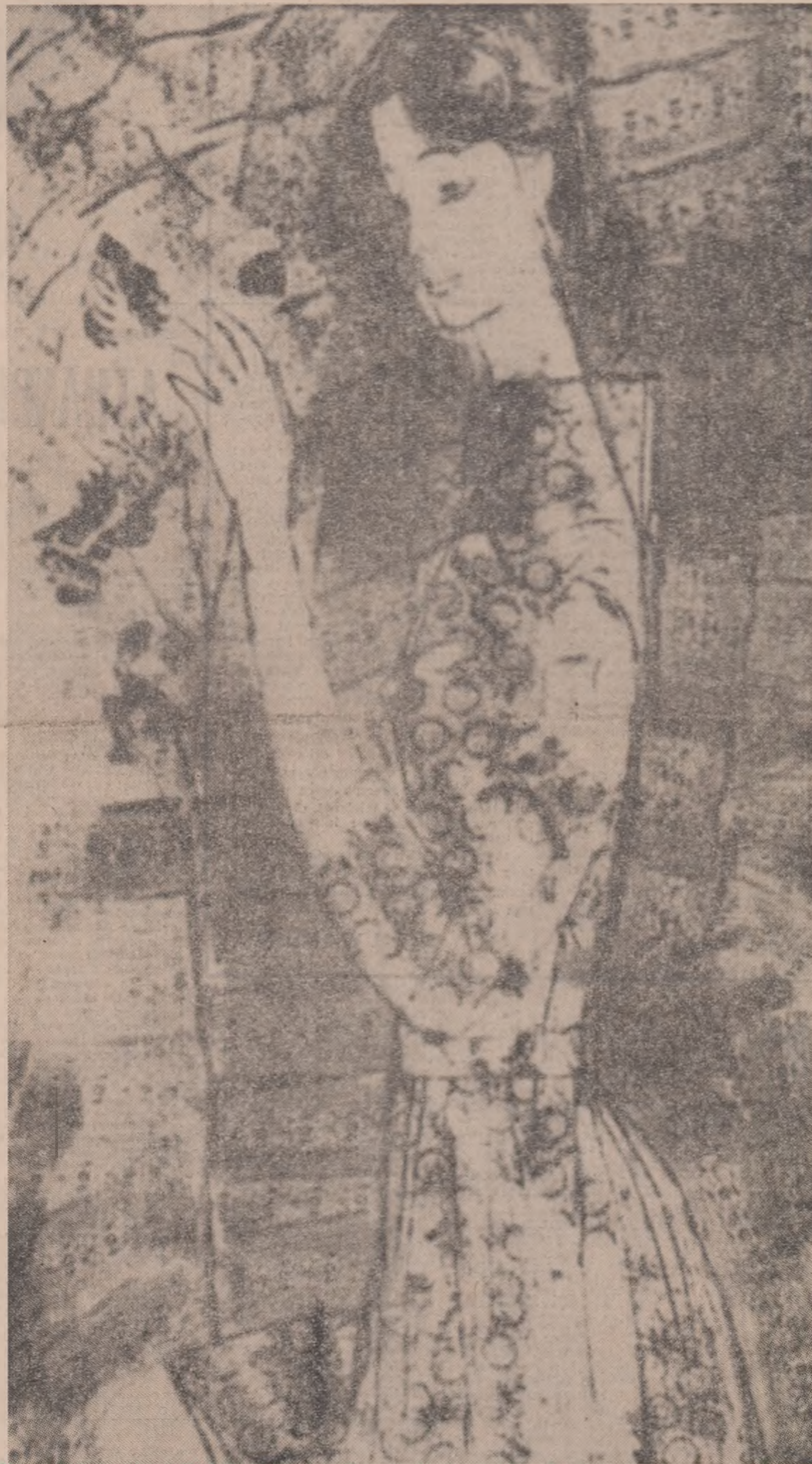
PAUL ERDOS — „ÎNCHINARE PRIMĂVERII”