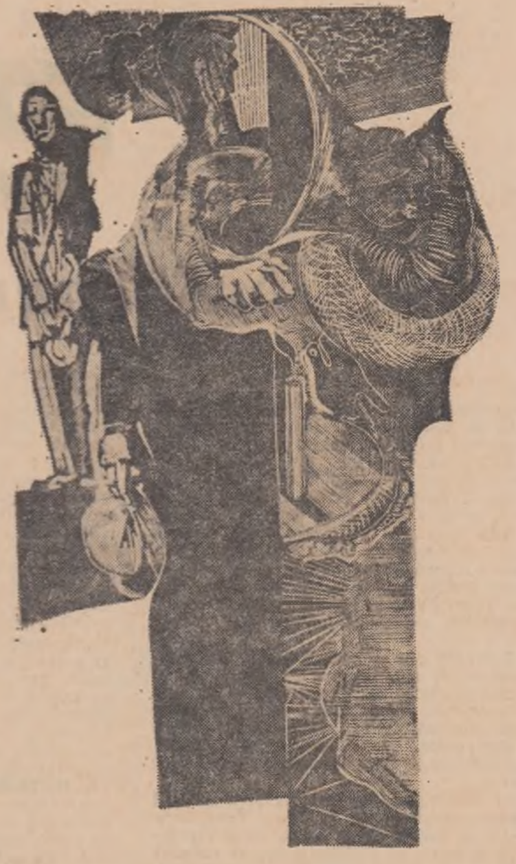
Ilustrație de DAN ERCEANU

Cum păsările se întorc Oarbe, iavite-n aripă Îrăgînd spre casă cerul sfîșiat Cum se întoarce-o fiară Luată de ape-n munji Doar cu mirasul, la vîrsta cînd se bot Urmașii în sămintă Cum vin să moară turme În miazănoaptea vîrșite Cu cea mai aspră, grea cuvîntă Eu mă întorc în ceasul De lumină în dulce carnea ta Primește-mă Sint muritor Și apă vin să beau Să îndrăznesc încă o dată trecerea.