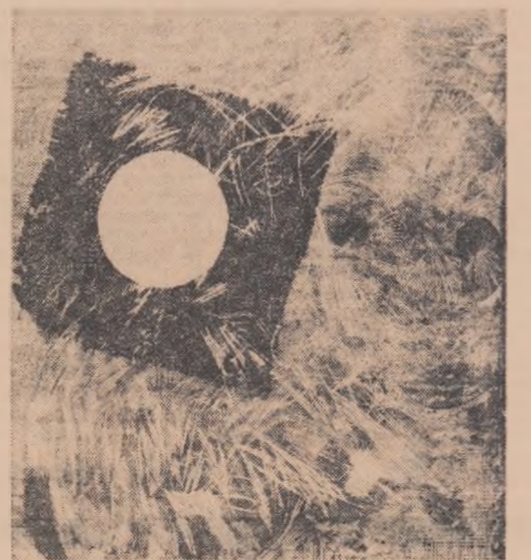
Desene de EUGEN POPA

Da, e o ispravă să doborîi trei bombardiere neînsoțite la mică distanță de terenul de aterizare. Dar pe urmă? Ce-o să facă inamicul? Care or fi forțele lui? Telefonul se auzi țîrlînd la postul de comandă al bateriei.