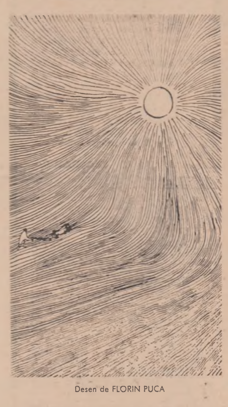
Desen de FLORIN PUCA