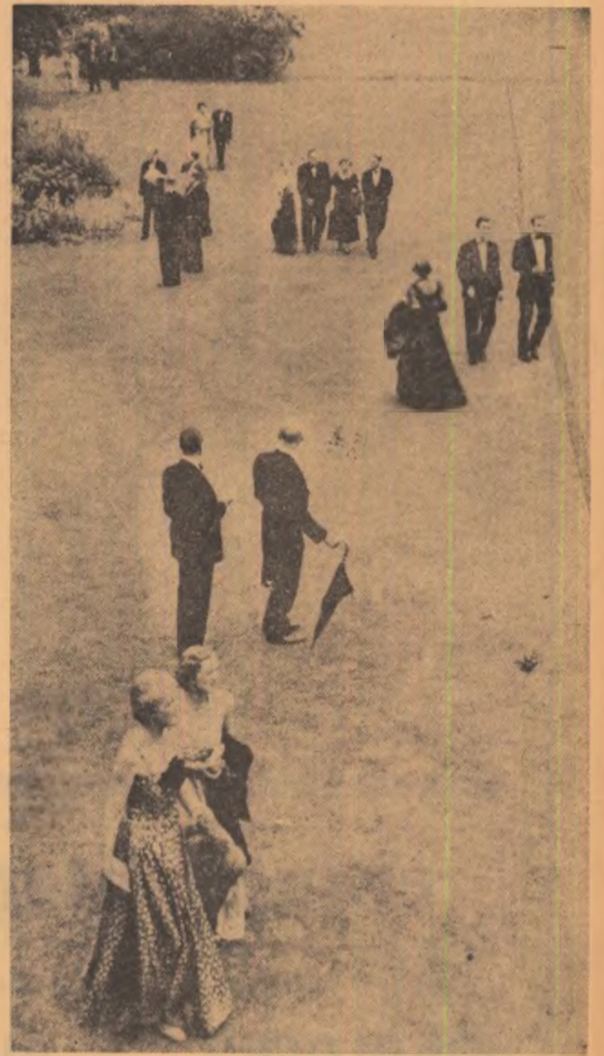
HENRI CARTIER-BRESSON : în timpul antracului unei reprezentații

Numărul de față este ilustrat cu reproduceri după lucrările artistului fotograf Henri — Cartier Bresson expusa la Institutul de Arhitectură din București