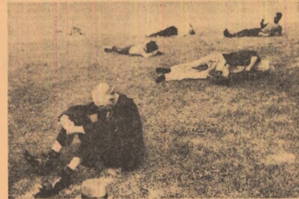
Boston, 1947 - Val de caldura

Tacuti, ca umbre lunecind pe ape Trec anii mei ca intr-un vis. Si nu stiu, lumea-i un acvariu Ori eu intr-un acvariu m-am inchis.