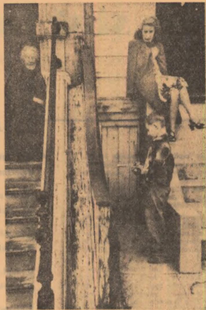
San Francisco, 1946

pe-o clapă neagră de pian opt răsturnat cu capul spart și bratul crucii netrelate furai de-o clapă neagră de pian