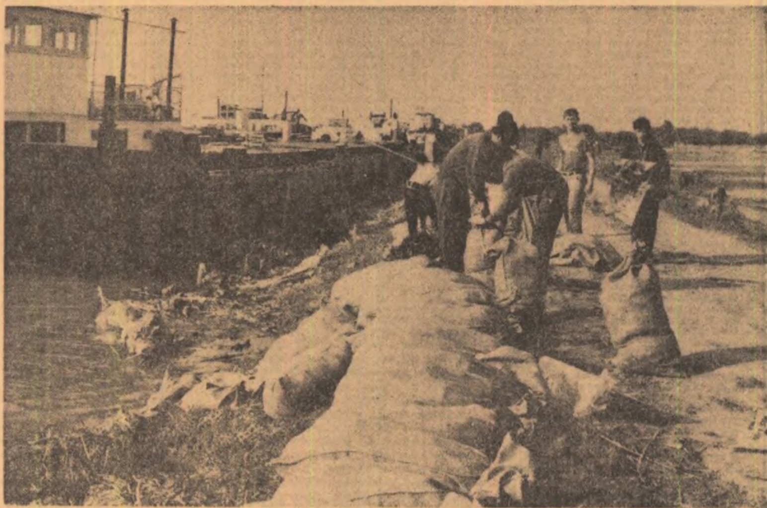
Coronament de nave și oameni pe digul Insulei