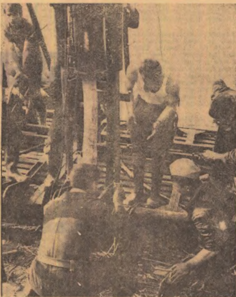
„Le toamnă venim să culegem porumbul pe care l-am apărât”.