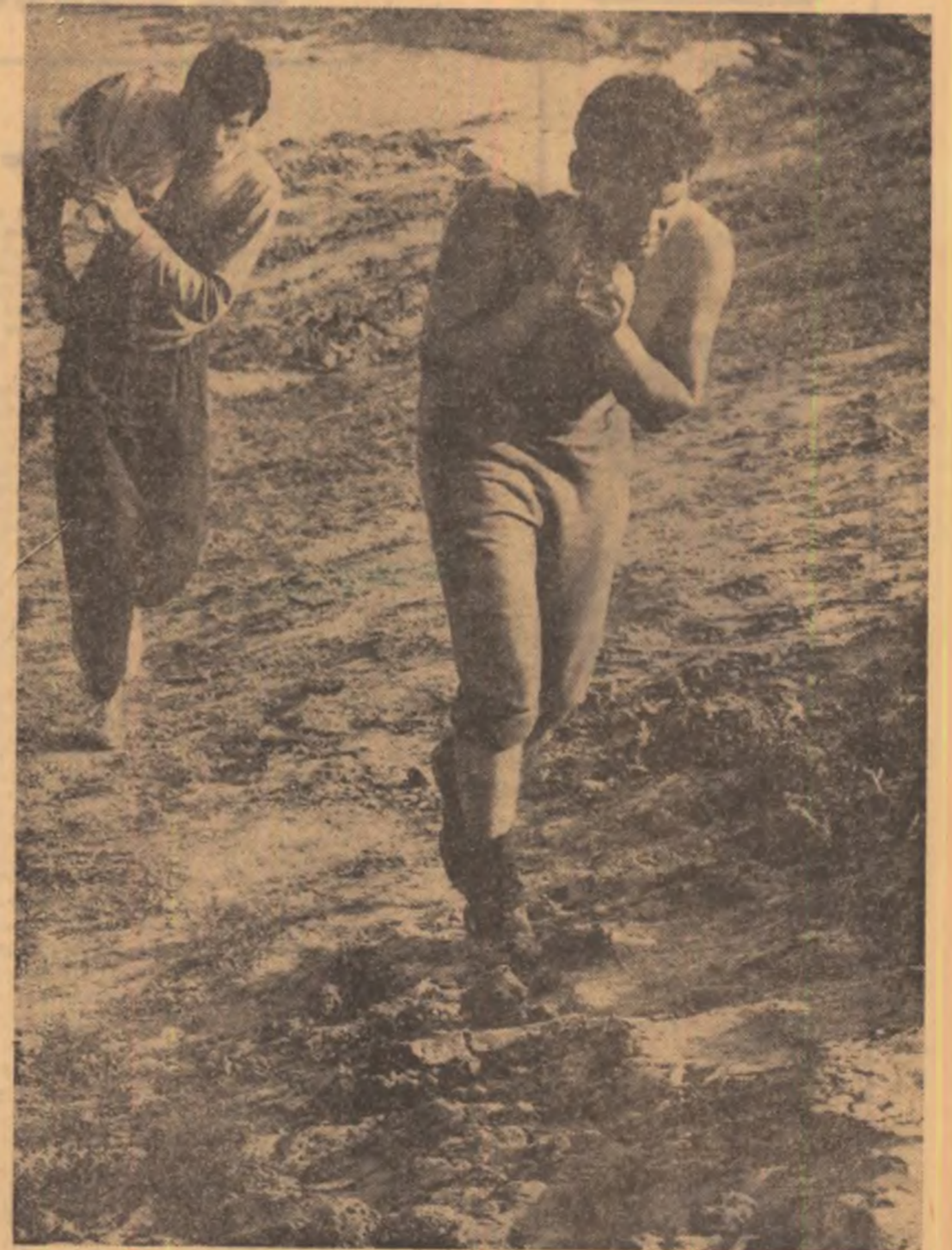
Sus. Un soldat și un student — imaginea speranței în sfârșitul digului nou pro Dunării. Jos: La dig în aceste zile — o Dunăre învinsă — va fi din nou o noapte.