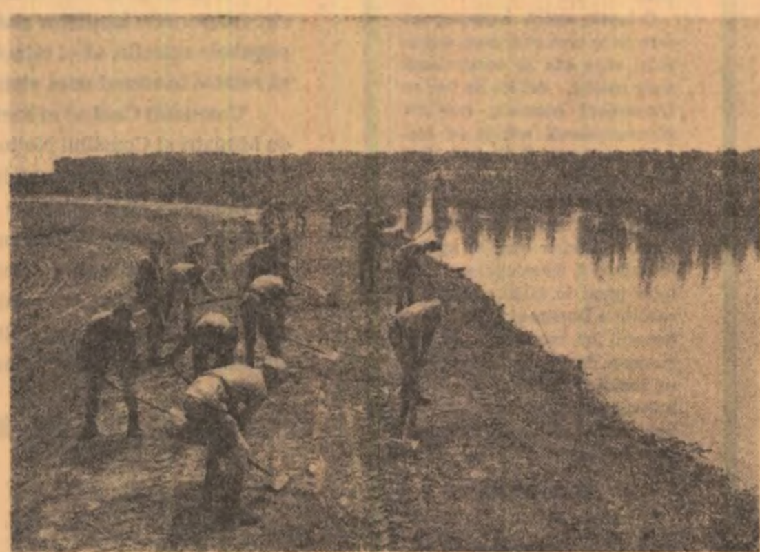
Participarea soldaților — semn al vigoriei și al dăruirii

la absența oamenilor, făcîndu-și un soi de cotec din ochiul de geam de la un pod. Pe grinduri izolate, s-au refugiat păsările și animalele cele mai diferite. Pe torasamentul cîiilor ferate, rupt și el în cîteva locuri, care tate în două o pinză de apă lăsată de peste douăzeci-șezeci și cinci de kilometri, ca o mare cenușie, fără orizonturi, incredibilă, aici, unde erau înainte cîmpii cultivate, s-au refugiat vaci, cai, măgari, oi, capre, găini, pisici, și mai ales cîinii lăfoși și uzi. Pe grinduri mai izolate, au putut fi văzute zile de-a rîndul cînduri de căprioare și de iepuri. Dobitoacele așteaptă rețragera apei, uitîndu-se cu ochii cuminți și nevinovați în oglinda tulbură de dedesubt. Inocenta naturii se înfruntă cu cruzimea naturii. Oamenii s-au salvat, casele se vor reconstrui, totul se va șterge treptat din memoria lor; totul, în afară poate de această melancolică resemnare a animalelor și a păsărilor, care simbolizează cea mai pură și mai nevinovată uimire, întrebarea fără de glas a naturii înseși în fața înspăimîntătorului ei prăpăd.