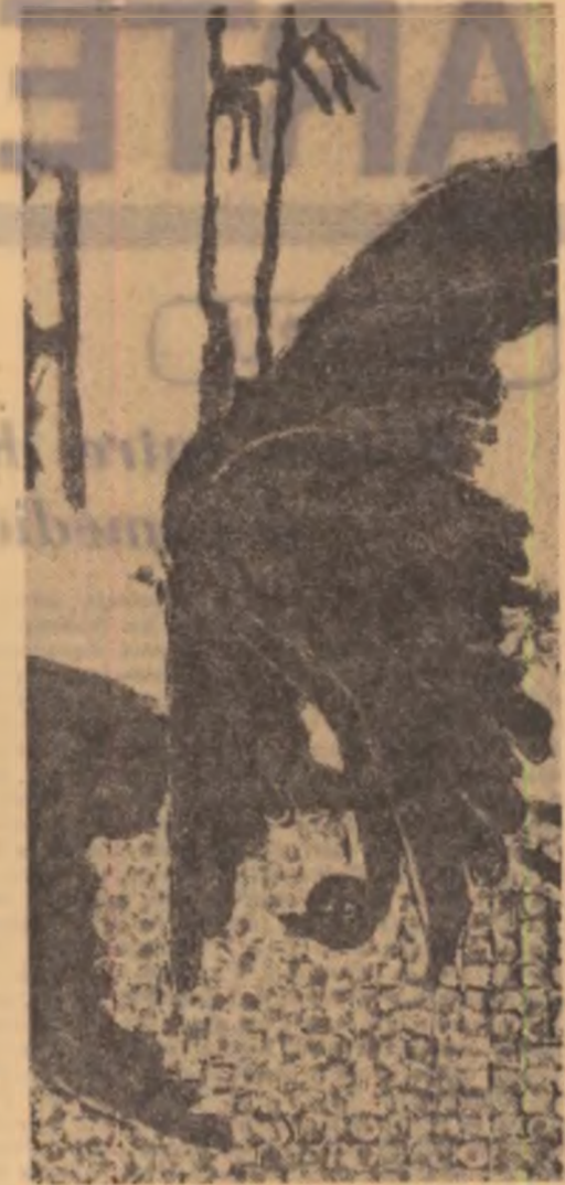
ION GHEORGHIU NATURA STATICA

colaci pomoniilor diurne pentru defuncta tinerețe și blănuri tălpilor bătrîne de-alt-adînc să ne le-nghețe.