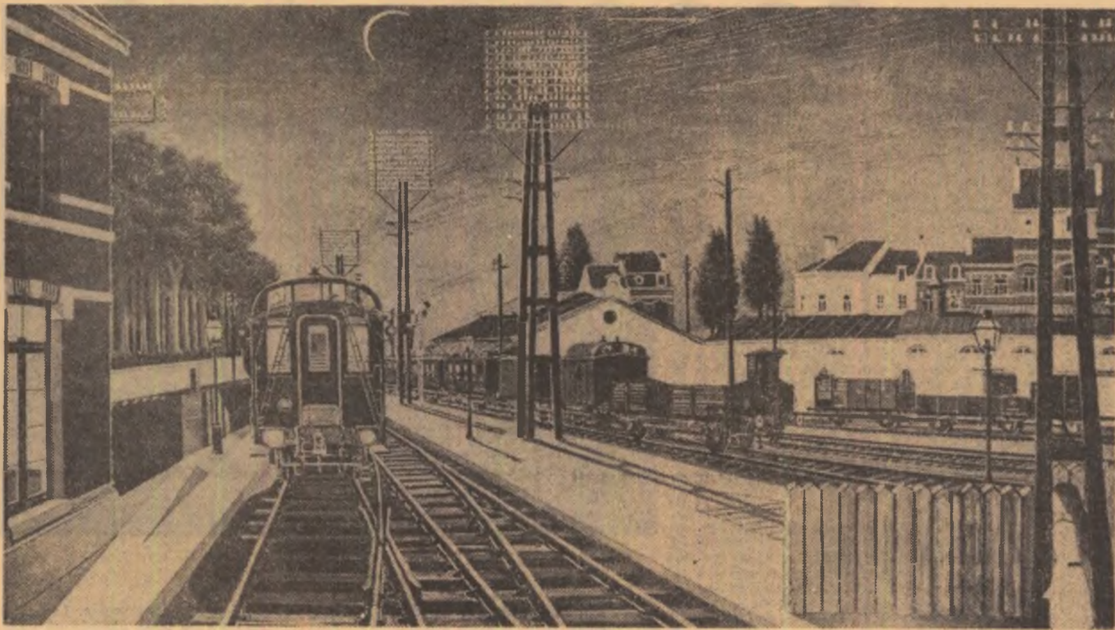
TRENUL DE SEARĂ de PAUL DELVAUX (Belgia)

— Știi, Riminaldi, șopti, acum sint ostenit de epave.