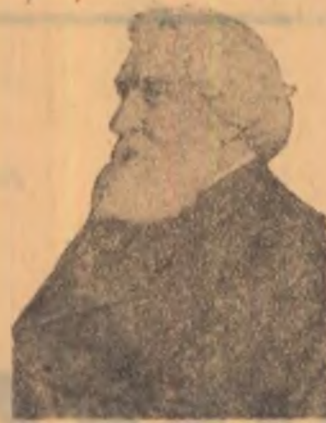
I. E. TURGHENIEV