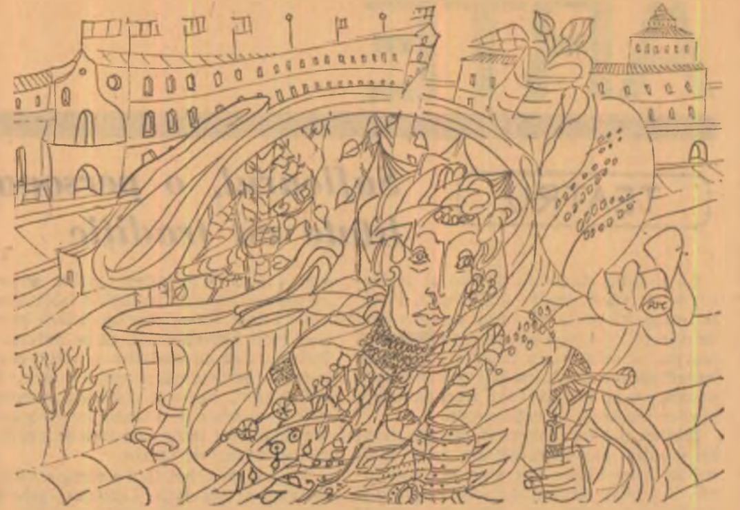
Desene de MARIUS RADULESCU

epava prințului poet prea multă piine și cuțit ce gălăgie-i omenirea peșemne că voi fi murit și mi s-a jefuit gîndirea