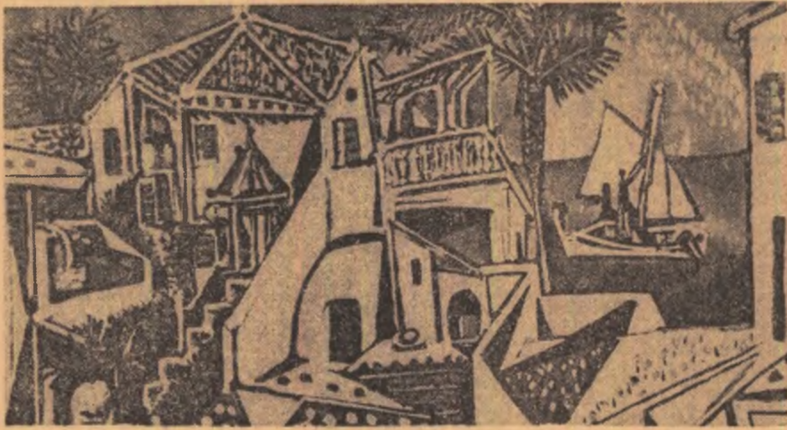
PICASSO: PEISAJ MEDITERANEAN (fragment)