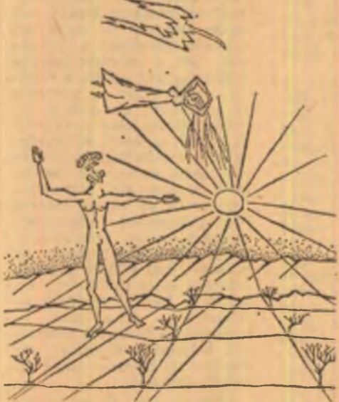
Desen de MIHAI PIENESCU

Nu-i nici o stea pe care s-o atingem în singurătatea noastră temătoare