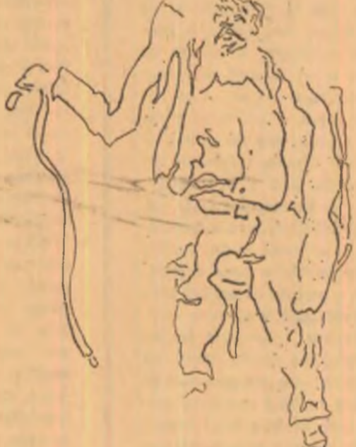
Desene de MICHAEL GRĂMESCU

Își simți răsuflarea rarită, deșirîndu-se. Avu impresia că sînt suspendați în gol, crengile umflăte pieriseră din palme și l se păru că încep să se plîndească hoștește. Uită și de pădure și de poiană și de lemnele albe, făcute pachet, cu groapa deschisă alături.