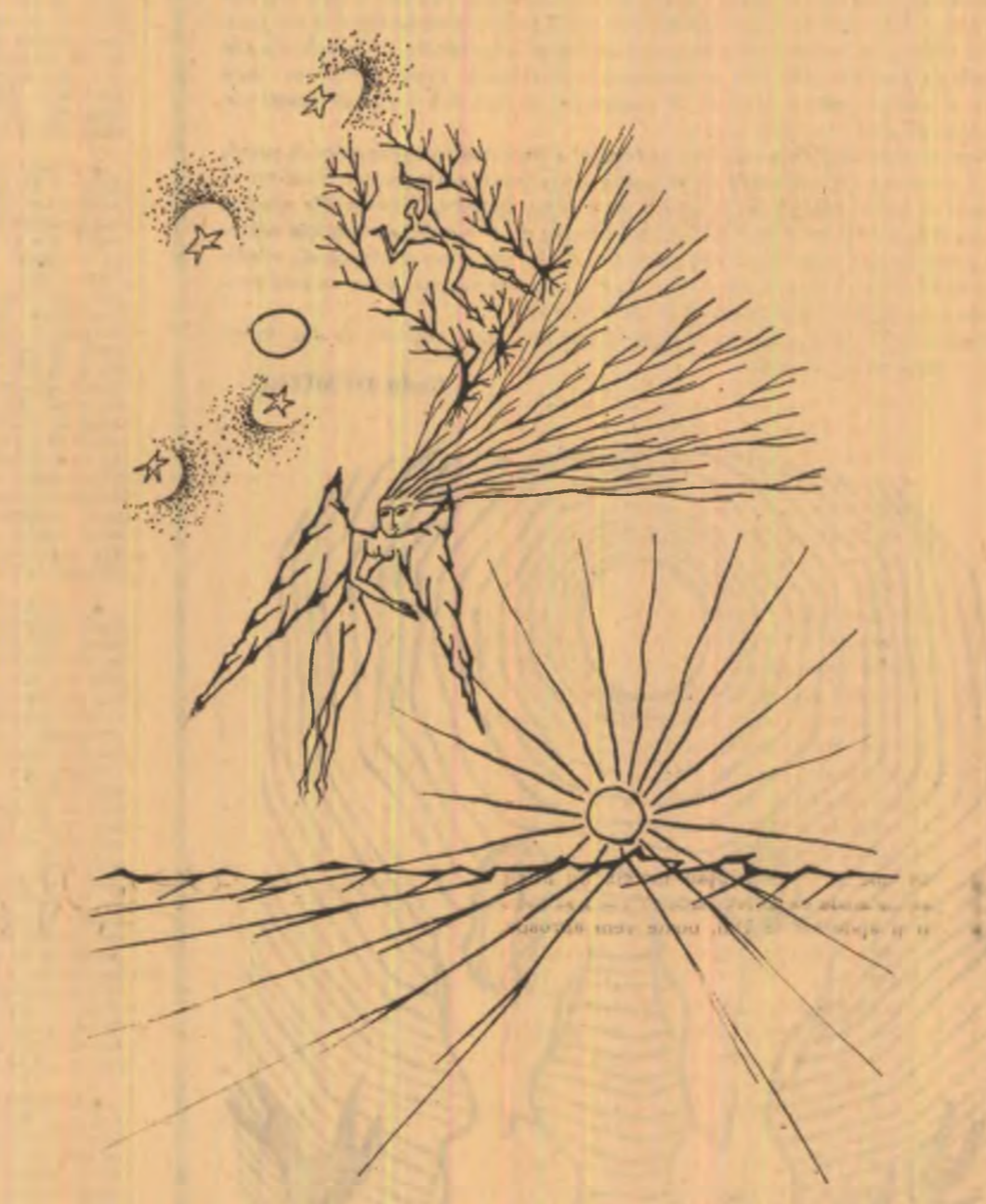
Desene de MIHAI PIENESCU