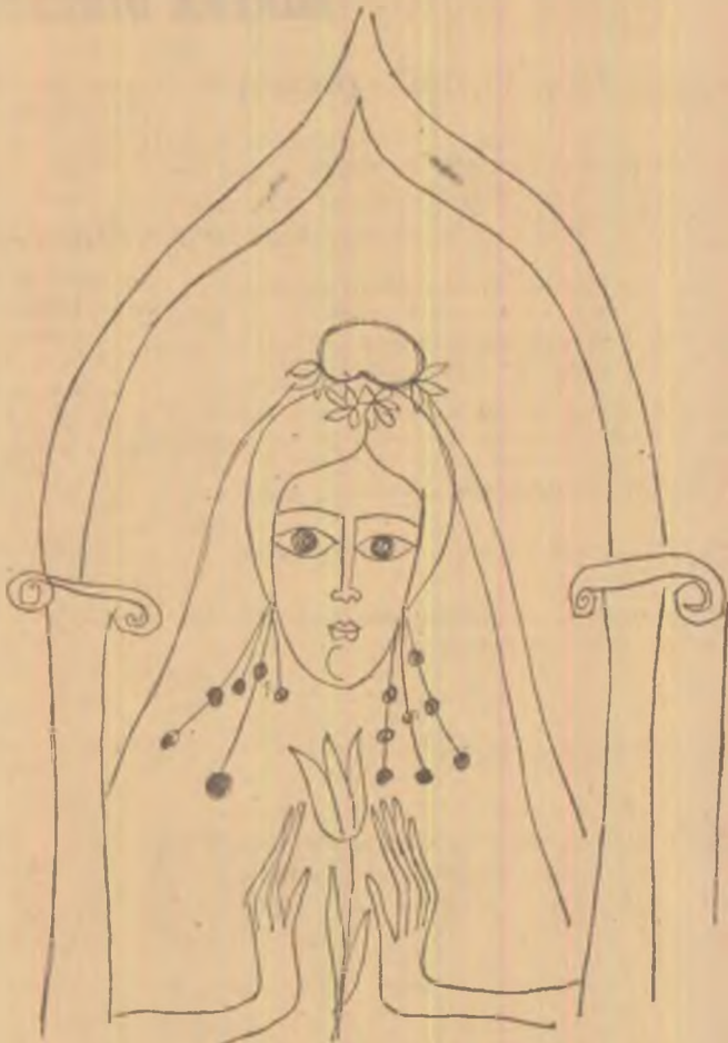
Ilustrații de LUCA ADRIANA

Că nu mai nînge, nu e vorba de asta, uite aș vrea lna să-ți cartea mai drept. Adesea nînsorea scapă dincolo cum lmi place la sfîrșitul lernii, recunosc, de ce nu, că e bine să te ocupi de fleacuri, dar iată, nu mai nînge, adică deplînde, este timpul, îți spu- neam.