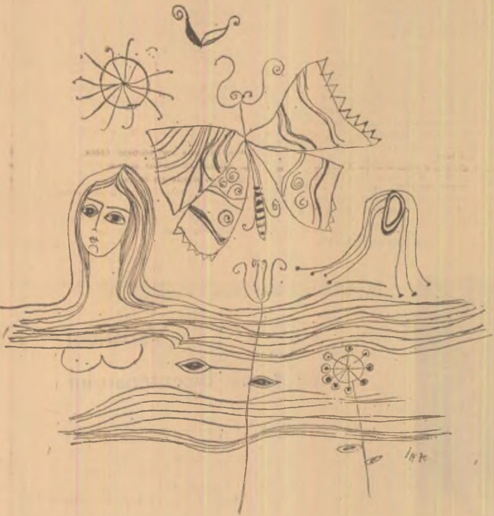
Ilustrații de LUCA ADRIANA

Și poate că și cu ea era la fel, pentru că în ultima vreme sta tot mai mult cu Crăița, doar că eu atunci nu mă gîndeam așa, știam, că fratele Crăiței e lector la italiană și mi se părea că mama avusese dreptate, de ce tocmai acum a găsit-o pe Crăița, mă gîndeam, cînd vrea să intre la italiană. Eram sigură că nu-mi place Crăița, deși nu-mi amintesc dacă așa fusese întotdeauna, și atunci după bacalaureat au vorbit să meargă împreună citeva