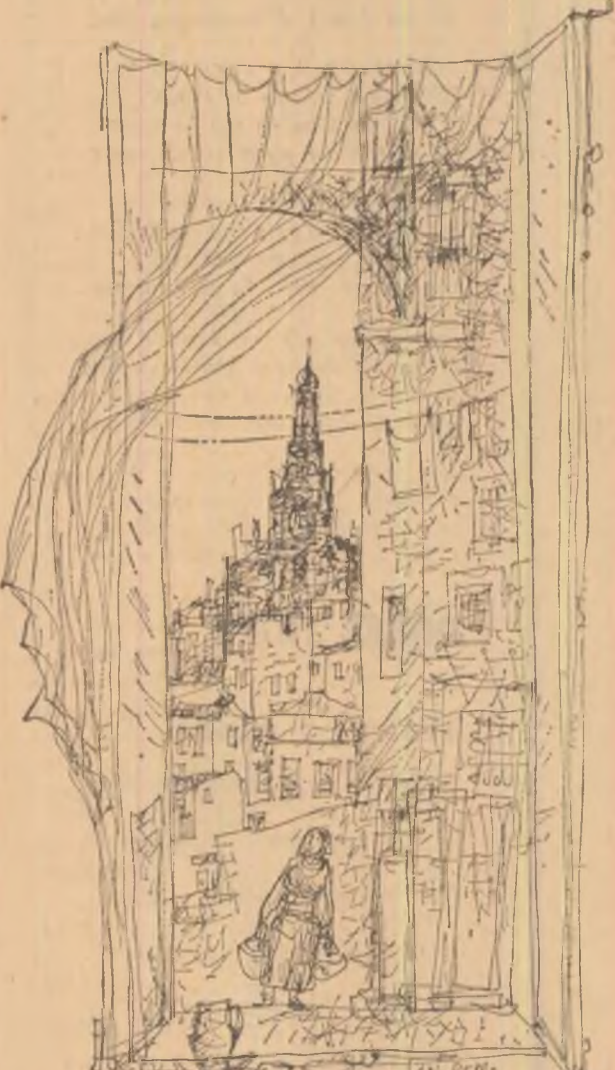
Ilustrație de MIHAI VULCANESCU

Și-mi va cădea, prin vîrstă, noian de clar de lună.