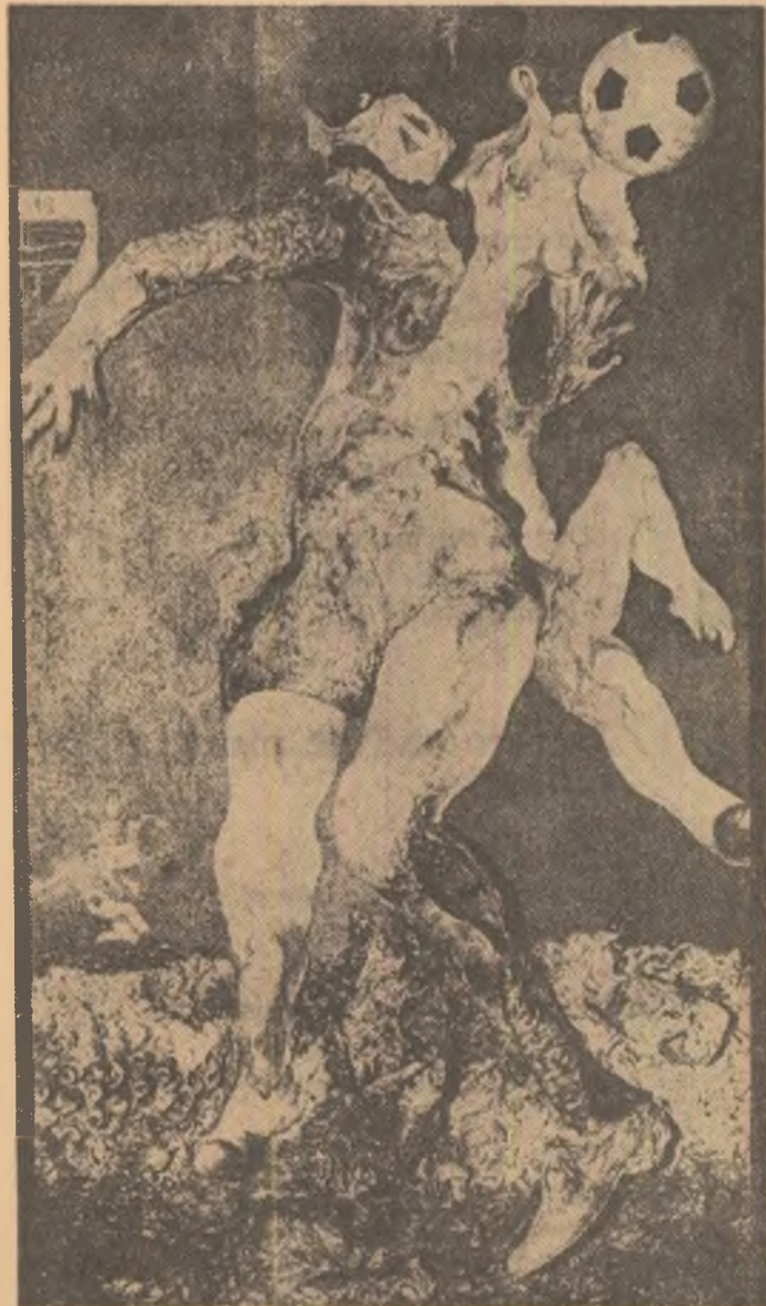
PORTAR ZBURĂTOR (Jucătorul Icar sau Jucătorul Inger) Tablou de FRITZ GENKINGER