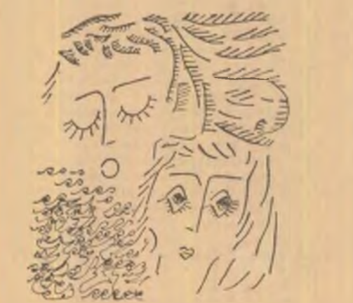
Ilustrație de IOAN VICTOR DRAGAN

...Eram și eu femeie... M-am ridicat încet și am intrat în camera de baie. Furnici de gheață mi-au invadat trupul zvicnind în sfîrcurile sinilor împletiri. Păsări înșingerate desena soa- rele pe pereții asudați. M-am oprit. În prag, cîntînd cu privirea nelipsita oglindă. Am ză- riș-o, lac fără fund, aninat într-un cui strîmb. M-am privit fără să mă recunosc. Gene lungi. Ochi mari. Nas fin. Buze fragede. Umeri ro- zunți. Oglinda era prea mică. M-am urcat pe un scaun schiop, nefolosit de mult și mi-am contemplat pentru prima oară trupul zvel, de animal fînăr. Cînd m-am săturat de mine am vrut să revin. Lîngă ușa erai tu. Acolo m-ai devorat flămînd de dragoste, fără odihnă, scrișînd din dinți... Am plecat fără să-mi iau rămăși. Nu știa. Nu îți-a dat seama. Ai fost prea fericit... Stau singură în odaia mea. Îți scriu. Ceva mă face să nu fiu mulțumită. Sou- rele a apus de mult. Astăzi sint alifel. Nu m-ai recunoscut oare? Mi-am lăsat părul lung. Îmi ră- zîje buzele. Îmi ptez ochii. Ochiul acela pe care-i sărutai cu buzele crăpate de nesomn. Mă crezi? Sint frumoasă. Sint așa cum numai tu ai putut să mă descoperi atunci. Ieri a venit un bărbat. M-a cerut în căsătorie. Am spus, da. Mă auzi? Am spus, da.