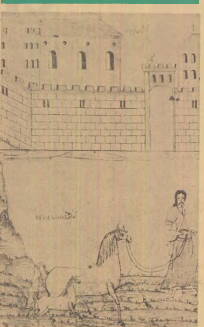
ILUSTRAȚIE DE EPOCĂ (CĂRȚI POPULARE)

Poetul a avut un ideal grandios de întemeiere a culturii naționale. Secolele fără acces la zona esteticului decît numai