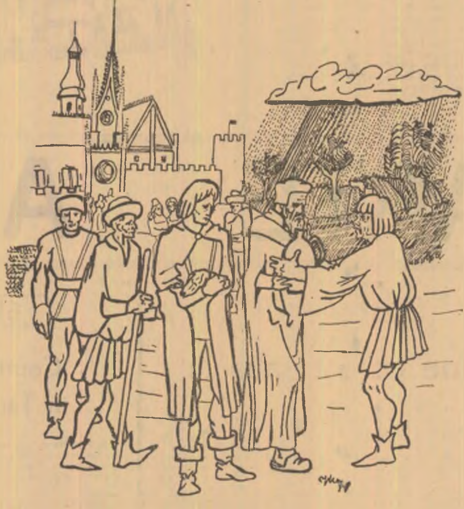
Ilustrații de VLADIMIR CIOBANU

Stam cocotată pe cămăla, care-și lega trupul masiv, și el mergea înaintea ei, cu un paș larg și rar, puțin ostent, fără să păra- sească o clipă însă, aceea ținută demnă de rege al deșertului, înalt și solemn sub veșmintul alb. Era o zi înăbușitoare, cu soare mult și fier- binte, a cărui lumină umplea văzduhul. O zi ca toate celelalte zile în lumea lui, dar unică pentru mine, o zi în care mi se dezvăluia o viață necunoscută mie pînă atunci, o lume cu oameni ce aveau alt zăbucim decît al ce- lorlalți; un zăbucim aproape tragic care trăia în dedesubtul aceluia cadru de măreție, sub strălucirea fastului, în care piramidele apă- reau triumfătoare în frumusețea lor vastă și sumbră. Mă stînjenea atunci faptul că nu puteam să mă bucur mai mult și să tremur de feric- ire c-am ajuns printre minunile lumii.