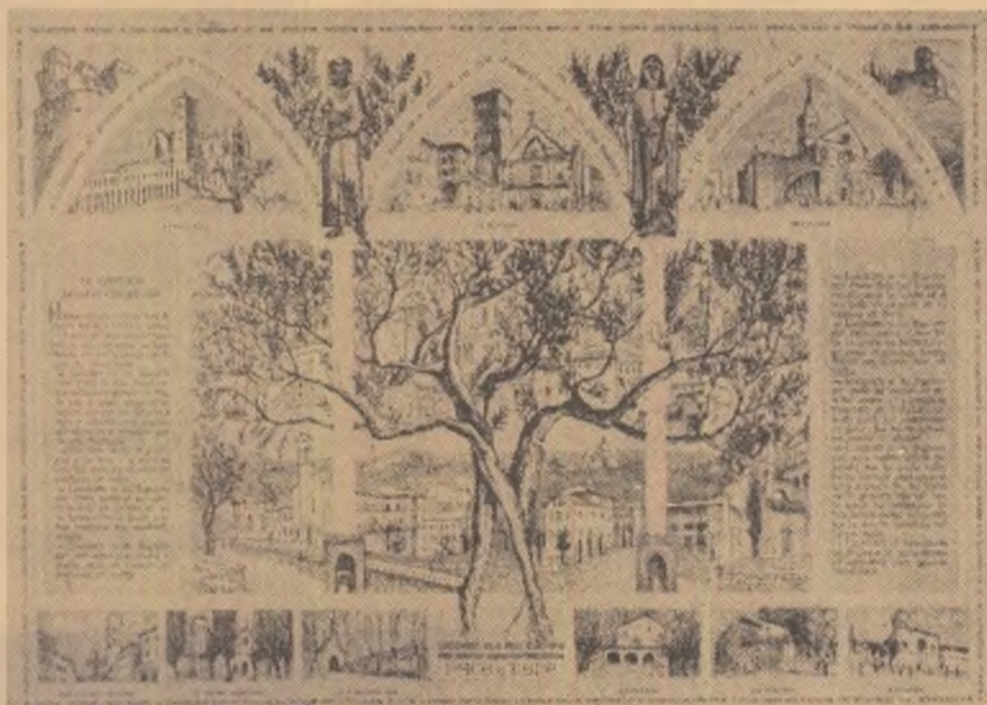
Desene de EUGEN DRAGUȚESCU