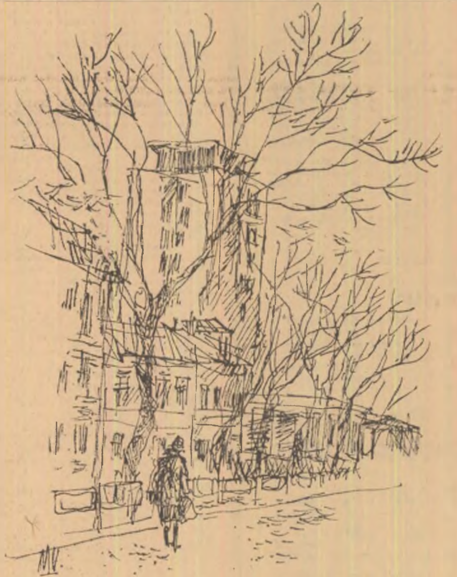
Ilustrații de MIHAIL VULCANESCU