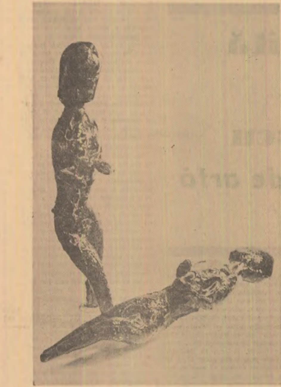
MARC TOBEY: ÎN AȘTEPTARE

ținut al uitării. Nevasta unui șef de gară pierdută în Bărăgan, după ce a contemplat îndelung un tînar frumos, de o fragilă frumusețe, reîntors după ani de ședere în străinătate, acasă, îi spune acestuia: „Numai să nu te înghită cîmpia, să nu mă uici. Aici, la noi, e pămîntul uitării, calci pe el, și nădejea se usucă, te înecă fumul, te acoperă noaptea”. (Acasă).