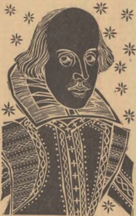
Portretul și ilustrațiile de VAL MUNTEANU