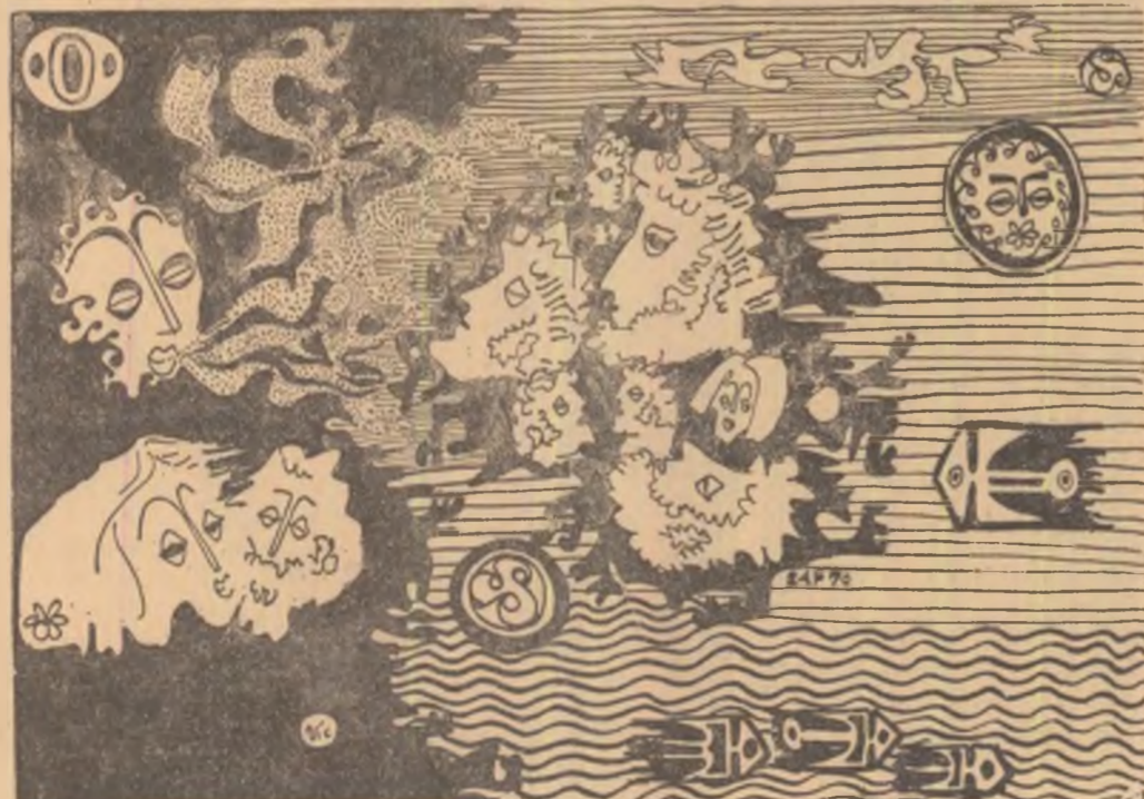
Desen de IOAN VICTOR DRĂGAN

șit care ne cuprîndea pe toți și mai ales pe mine, te făcea să suferi din ce în ce mai tare. Cine zice că-i ușor să scoți o medie de cinci cînd ai patru, patru, patru și trei în teză, se înșală. E greu. Și nu numai pentru tine, ci și pentru profesor, care ori-cîți de zece ți-ar da, tot nu iese media. În cele din urmă mă fofilam și-i