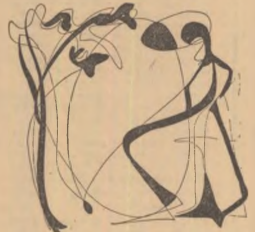
Desene de VERA HARITON

Nu-i, nu-i nicăieri, cine știe ce zdreanță căutăți și noi, ăștia. Nu-i, gîndești tu? căzură vorbele de dincolo. Nu-i?