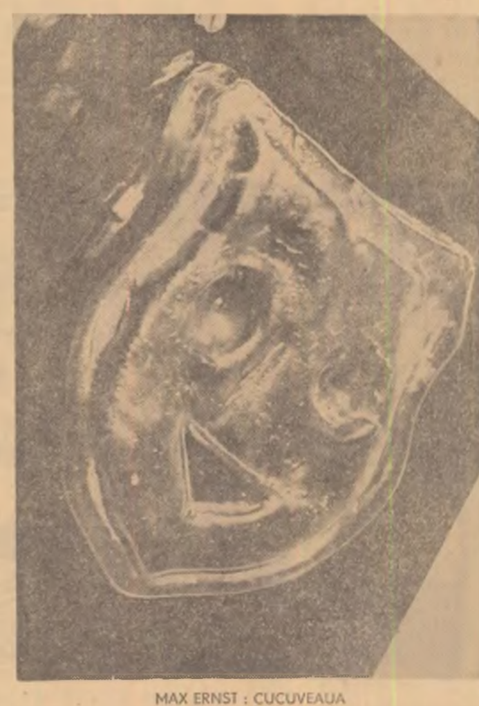
MAX ERNST: CUCUVEAUA

Dar virusii, dar microbii?... Nu, în mijlocul oricărui grandori, să nu uităm ce e încă mizerabil. Inima mi s-a strîns cînd l-am văzut pe cel trei oameni ai stelilor cu botnițe la gură, intrînd la trap în dușă ca niște vădufăciori, făcînd totul semne prietenești și pline de speranță spre carantina lor, — lasă că trece.