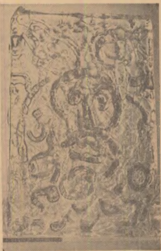
MARC TOBEY: PRIVELIȘTE MARINĂ