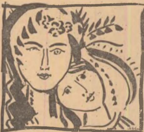
Desen de GHEORGHE DOBRE

șit care ne cuprîndea pe toți și mai ales pe mine, te făcea să suferi din ce în ce mai tare. Cine zice că-i ușor să scoți o medie de cinci cînd ai patru, patru, patru și trei în teză, se înșală. E greu. Și nu numai pentru tine, ci și pentru profesor, care ori-cîți de zece ți-ar da, tot nu iese media. În cele din urmă mă fofilam și-i