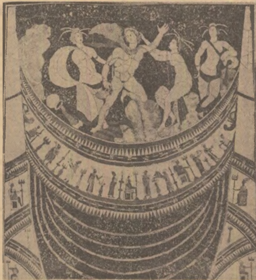
Ilustrațiile paginii: reproduceri după albumul „MOSAICO E MOSAICISTI NELL' ANTICHITÀ”, editat de Istituto della Enciclopedia Italiana.

Exagerarea este prima lege a artei. Un pom de trei ori mai mare decît pomii din jur, sau de trei ori mai mic, — devine un monument al naturii, — adică un obiect de artă. Cel care îl iubeste se modifică pe sine. Se modifică acceptîndu-l prin iubire, sau, din iubire de pomi face un pom de trei ori