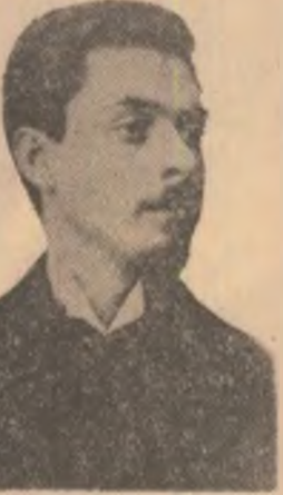
ȘT. O. IOSIF