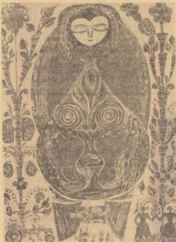
Gravuri de MARIANA POPA