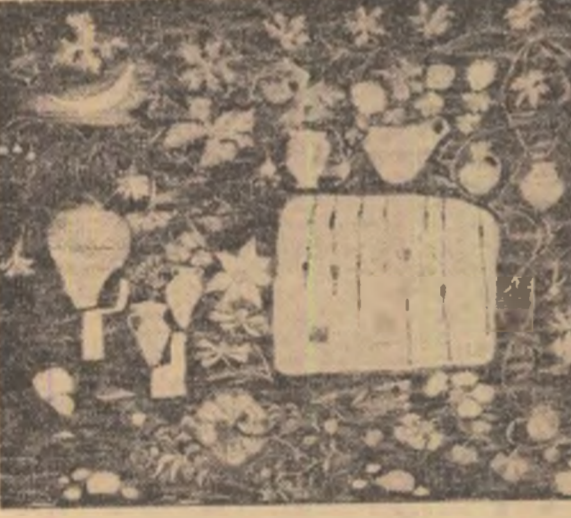
Tapiserie de MIMI PODEANU