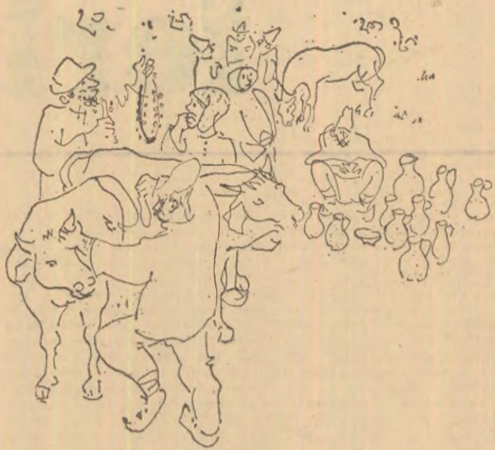
Ilustrație de CONSTANTIN BACIU la AMINTIRI DIN COPILĂRIE