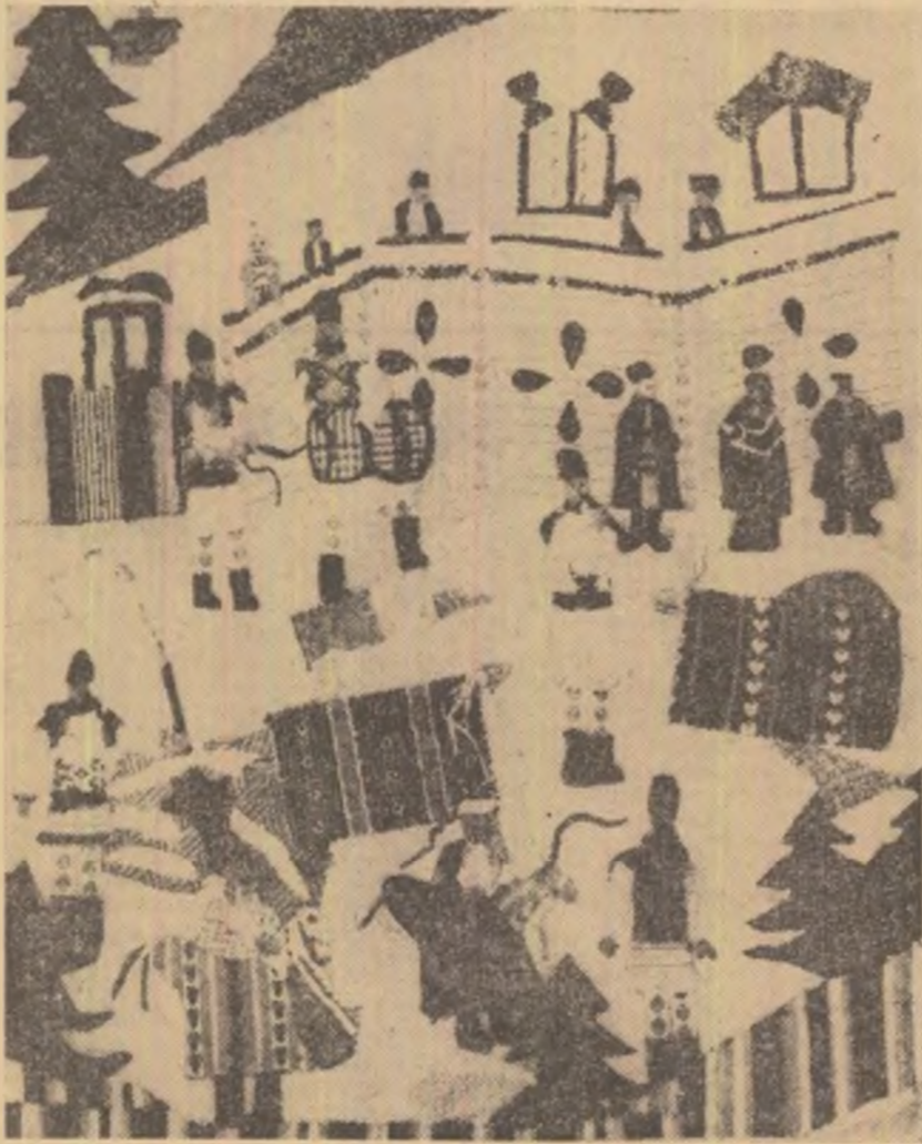
RODICA VLADIMIRESCU (Liceul nr. 1 Dorohoi): SĂRBĂTOARE FOLCLORICĂ Premiul special U.T.C.