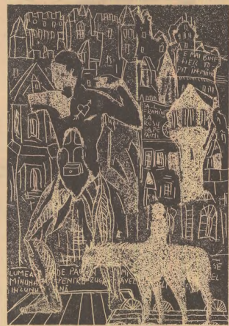
DESENE DE SABIN ȘTEFANUȚA

Vibrează-n arbori sevele prelung Și-alăturea de singe urci în băbați. Ce bine-mi stă ca sint aici Și port efigia munților Carpați.