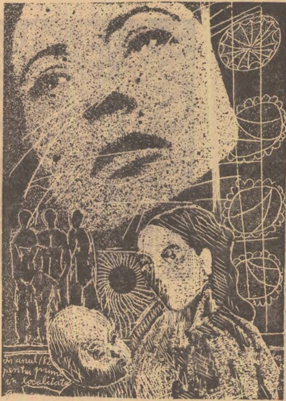
Un copil din pentru prima în localitate