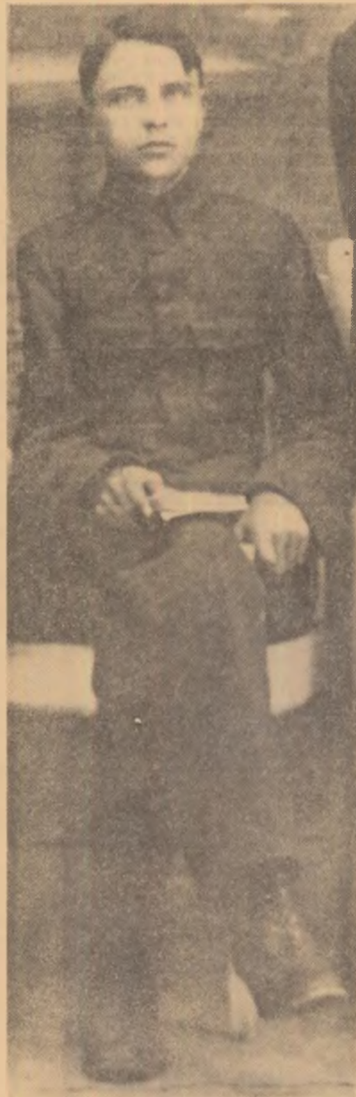
ZAHARIA STANCU la 16 ani (fotografie din anii 1917-1918) „Citeam tot ce-mi cădea în mînă și mă pregăteam să debutez în literatură.”

Perioada trăită la Turnu Măgurele mi-a fost prielnică scrisului. În oraș, după plecarea ocupanților nemți și după demobilizarea ostașilor care făcuseră războiul și-i