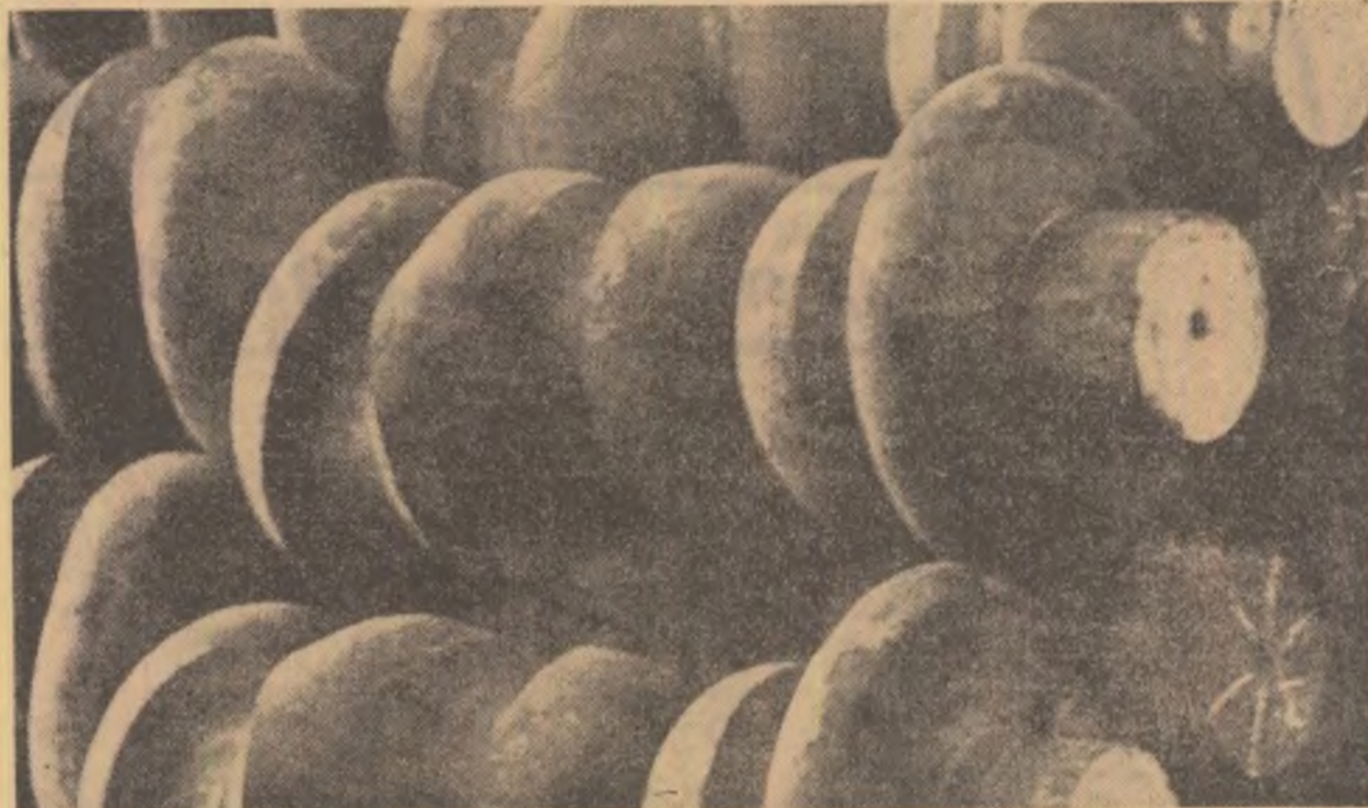
Arbori cotiți de la Uzinele de construcții de Mașini-Reșița