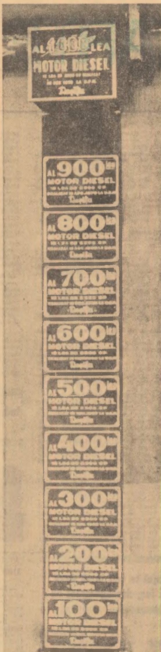
Scara numerică a motoarelor Diesel pentru locomotive fabricate la Reșița. (Imagine din hala mare a Uzinelor de construcții de mașini-Reșița)

Reșița merită să fie lăudată măcar o dată la 200 de ani. Ea este un mod al prezenței și al demnității noastre în lume.