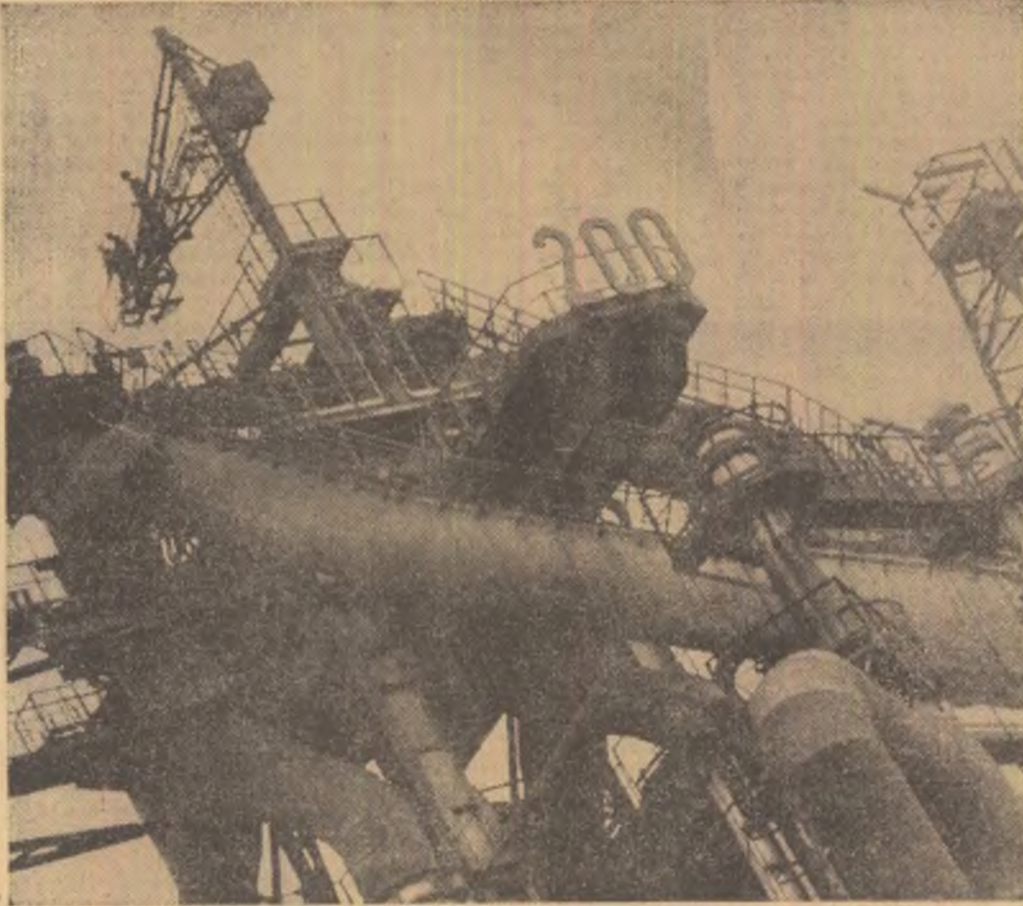
IMAGINE INDUSTRIALĂ A REȘIȚEI

— Ce să văd ? am întrebat cu uimire. Ce să văd mai înțeli ? Ce mi-ați spus dumneavoastră este cit o viață de om.