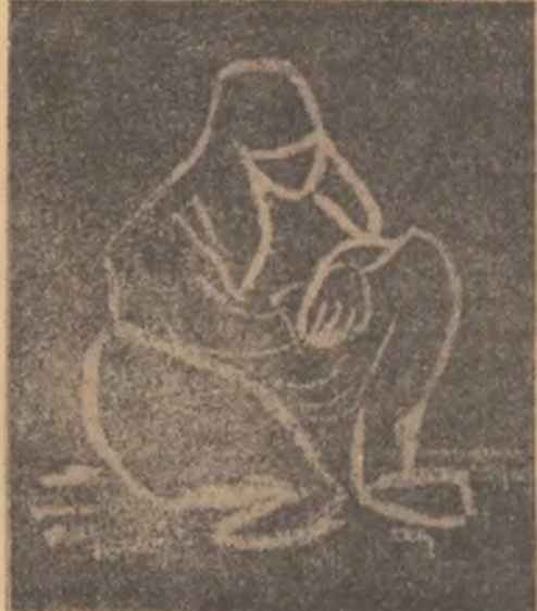
Desen de ESKIN NAYIR