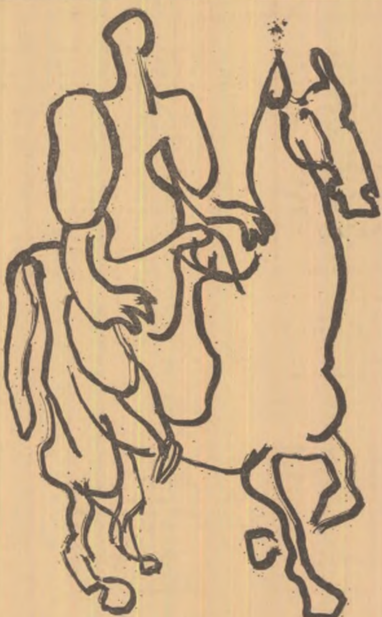
Ilustrație de TUDOR JEBELEANU

nîmic! Ce pulberi și noroade, cu Indii și minumi, E trist și sterp pămîntul — un bob de chihlimbar In talgerul de aur la un banquet de zei — Plictis fără de seamăn în timpul fără veac. Cunoști, iubita mea, abisul din Pacific?..