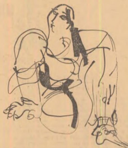
Ilustrație de TUDOR JEBELEANU

Poetul nu vorbește ca toți oamenii și ar însemna să-l osindim la tăcere, pretinzându-i să respecte regulile limbajului obișnuit. Numai un Anghel Demetrescu putea să-l certe pe Eminescu pentru că i-a zis morții, „inger cu părul blond și des”, cînd știut e ce chip de hircă are. Cine a auzit vreodată de o cremene „usu-re”? Unde s-au văzut fete frecîndu-și de lună umerii goi? Ce fel de exprimare sucită e asta: „scriș, riul trece în mai-albastru”? La asemenea întrebări nu rezistă nici Argezi, nici Blaga, nici Ion Barbu?