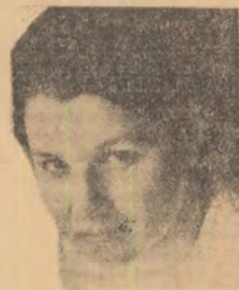
CONSTANTA BUZEA Sala nevrlilor Sonete. Editura „Cartea Românească”.