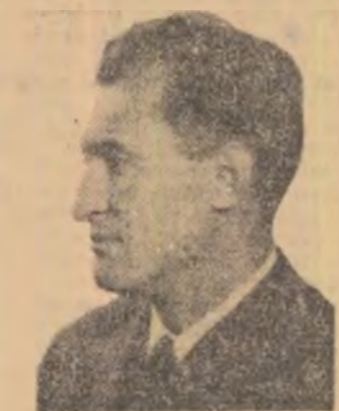
CONSTANTIN CHIRIȚA Intîlnirea (2 volume) Ediția a II-a, revăzută. Editura „Albatros”.