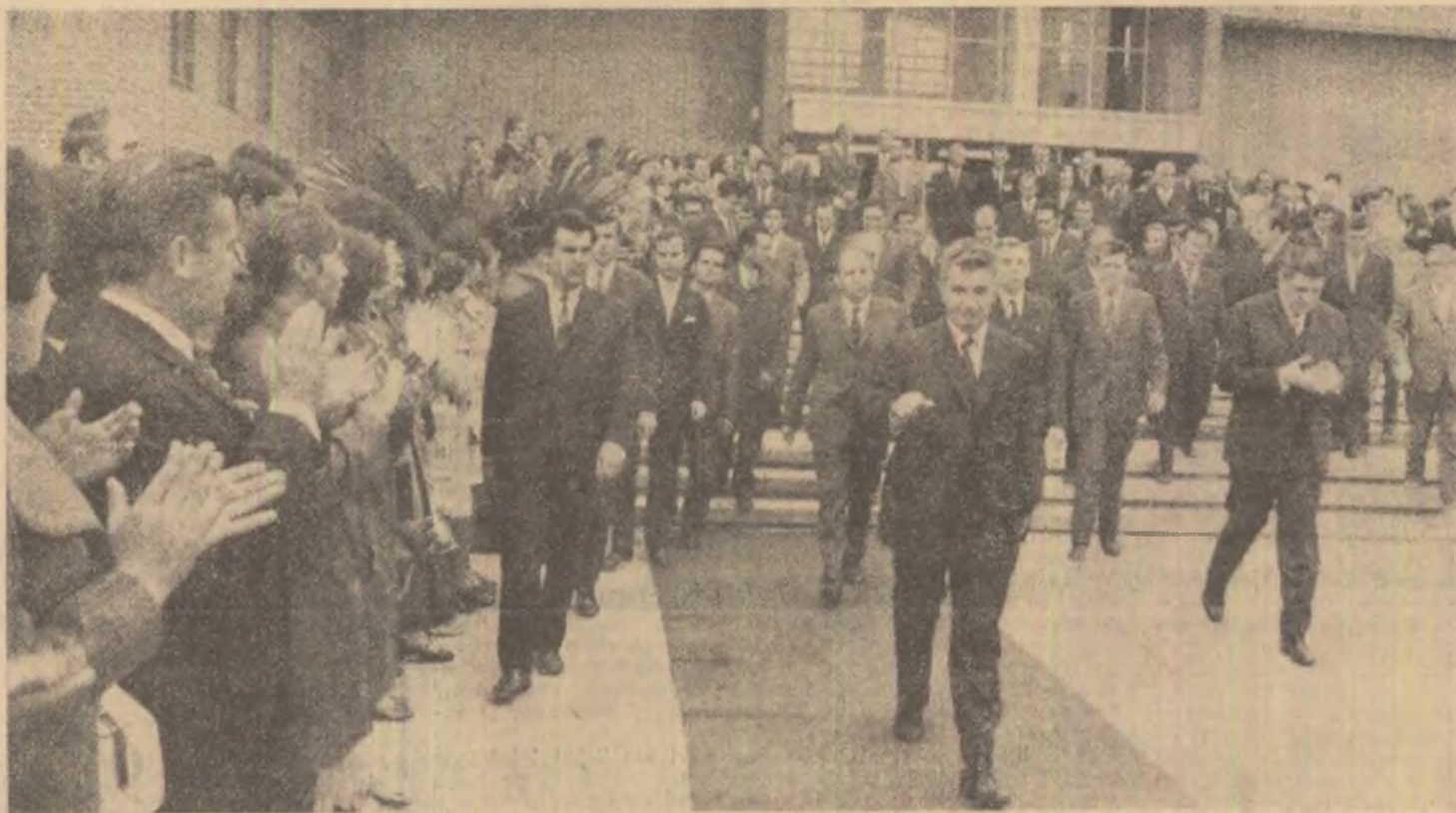
1 octombrie 1971, — deschiderea anului universitar. Tovarășul Nicolae Ceaușescu la Institutul Politehnic din București.