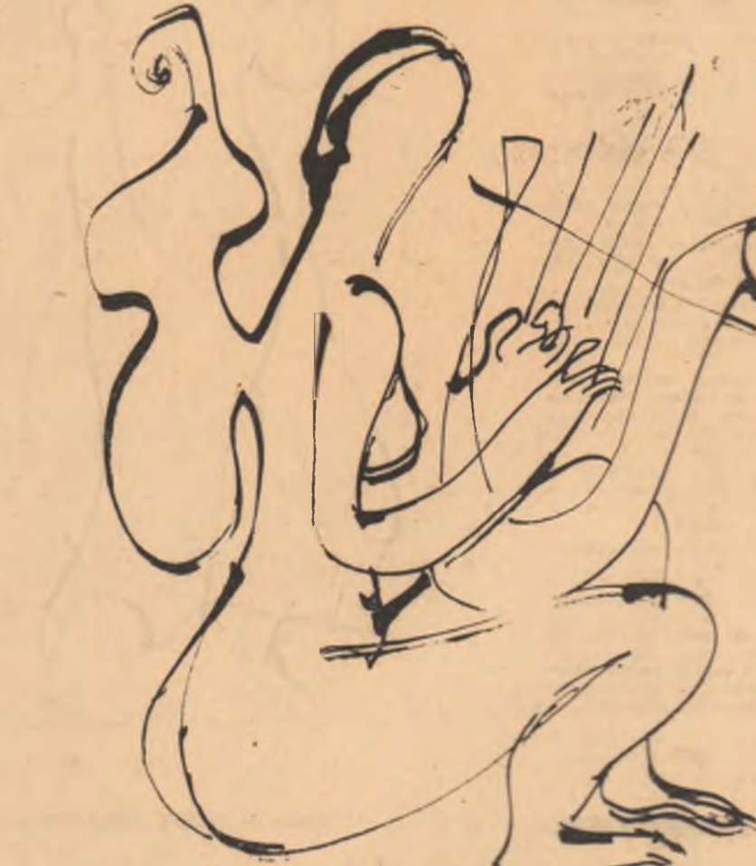
Desene de TUDOR JBELEANU

Spicuesc din opiniile criticilor de artă italieni care, detectând inspirațiile informale, proclamă fără excepție personalitatea picturii române, fantezia lui care transpune, transformă și reinventează. Constantin Udriou