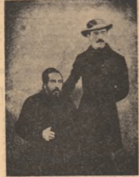
Ion Ghica și Vasile Alecsandri la Constantinopol

Vorbeam mai înainte despre aptitudinea obiectivității în proza lui Ghica, aspect care spune și altceva decît fixarea într-un regim de expresie determinat de predispoziții interioare. Și anume că acest autor redactîndu-și „sub formă de epistole intime” amintirile din ti-