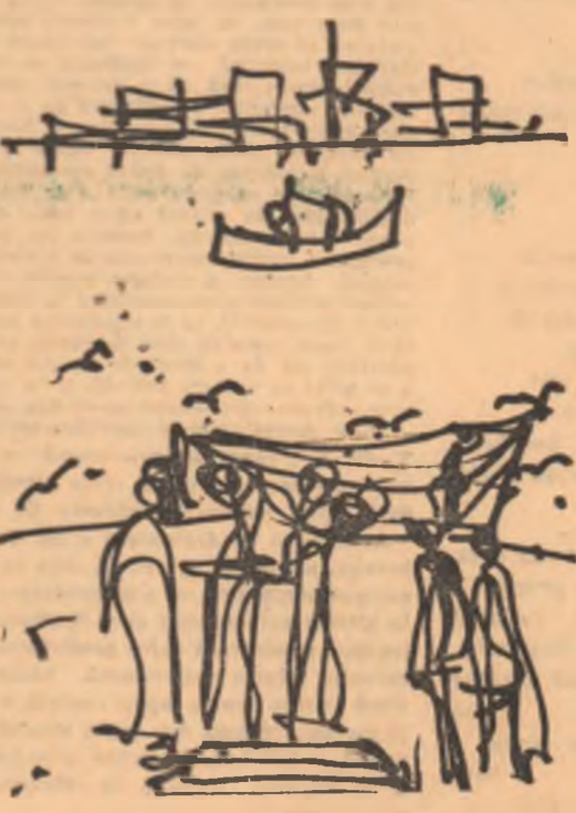
Desene de SABIN ȘTEFANUȚA

IMPLINEAM CINCI ANI în anul Războaielor. Ce forțat era în casă ! Bunicii stăteau mai mult la noi. Se citeau și se reciteau știrile din Dimineața. Într-o zi am observat la poarta casei un soldat cu pușcă. Eu îl plîndeam cu teamă, pitit după pietrolul mare de sub salcimi (camuflat pînă la nas).