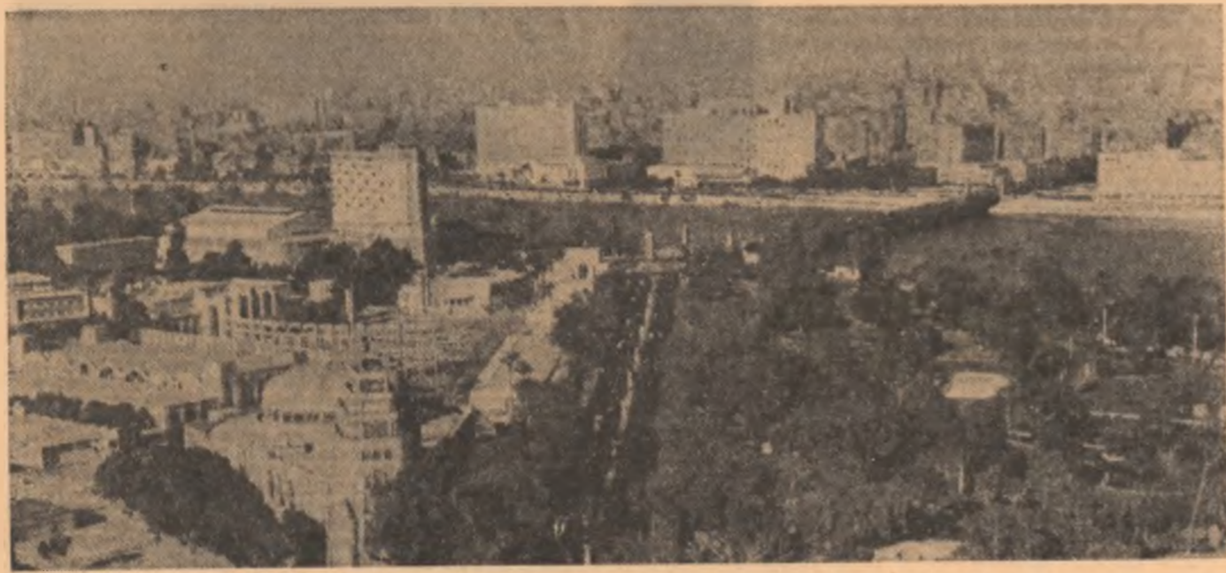
Vedere panoramică a orașului Cairo.

gustori este încrezătoare în ziua de mîine. Cred în ziua de mîine cum credeau în soare vechii egipteni. Pentru ei ziua de mîine este soarele, speranța, viața.