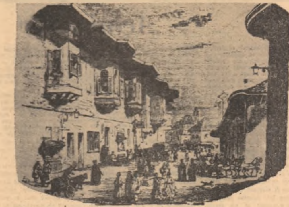
Stradă în București (jumătatea sec. XIX).

Tot ce povestește Ghica e văzut de un ochi care seizează contrastele și inadecvările sociale iar divulgarea acestora e una din sursele pe care simțul său comic le exploatează cu precădere. Satira lui e totuși fără violențe, rezolvîndu-se, de cele mai multe ori, în umorul destins și înțelețor al omului care privește în urma sa cu optica temperatoarea a distanțării. De altfel, lansat de pe baricade re-