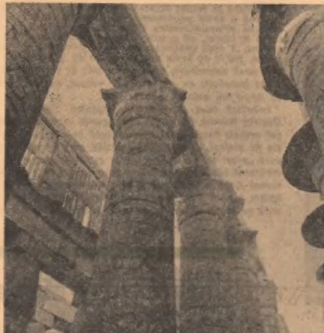
Ruinele templului Karnak de lângă Luxor

Prin diversificarea recoltelor, țăranul are venituri frumoase. Cu o mică parte din prețul recoltelor sale își cumpără, pe credit, îngrășămintele chimice. Nu-i prea ieftin un sac de îngrășămintele azotoase, dar țăranul are avantajul că nu-i obligat să plătească imediat. Și acest lucru este un stimul pentru țăran. Fiecare vrea să aibă recolte cît mai mari, să