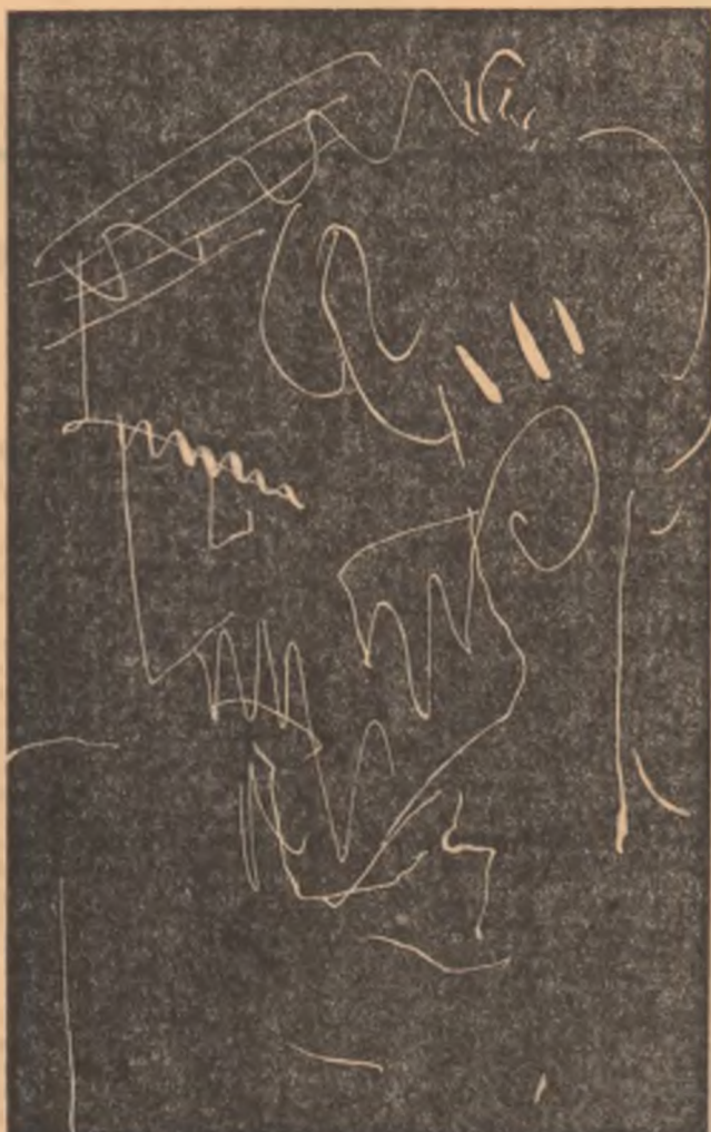
Desen de CONSTANTIN POPOVICI