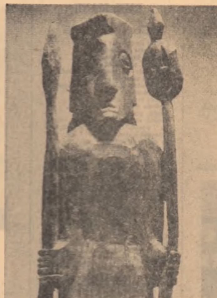
Sculptură de IVAN STANLAVEVICI (Iugoslavia) gura mării