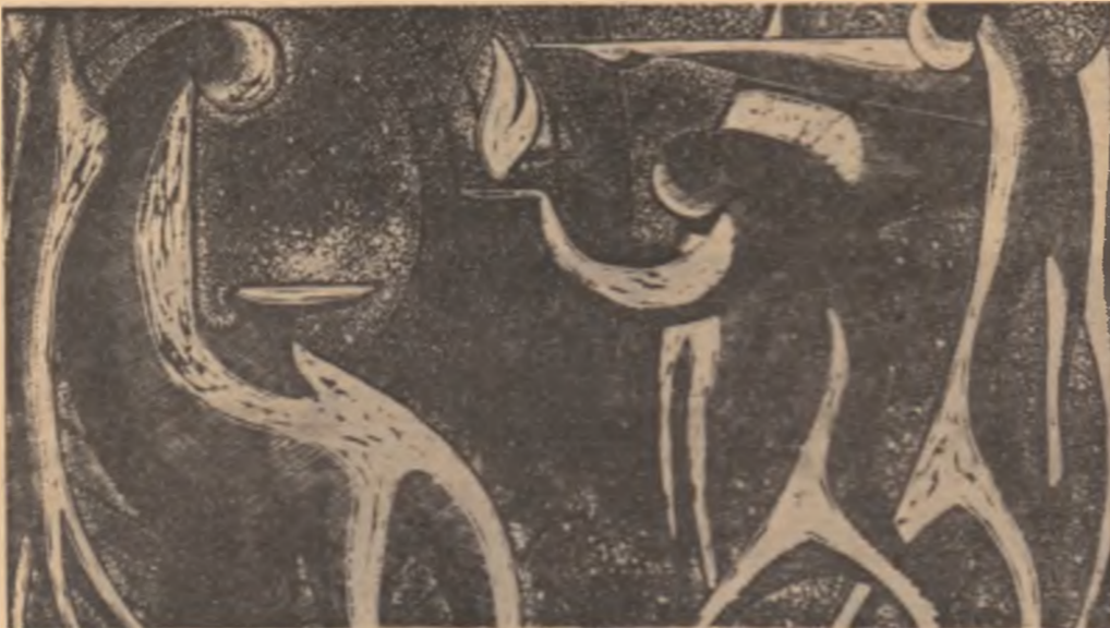
MEDARDO ESPINOSA : „OFRANDA”

Oglinda e oglindă pe cît cuprinde lumea, așa cum lumea-i lume după ce reflectă. Lume, oglindă singerindă, imi arăți războaiele tale ridicole, mizeria absurdă, orașele nimicite ! Cunoaște-ți, lume, ființa adevărată ! Reîntregită va fi viața, dragostea, oglinda. Cunoaște-ți, lume, ființa adevărată ! O mantie de hermină pentru picioarele tale desculțe.