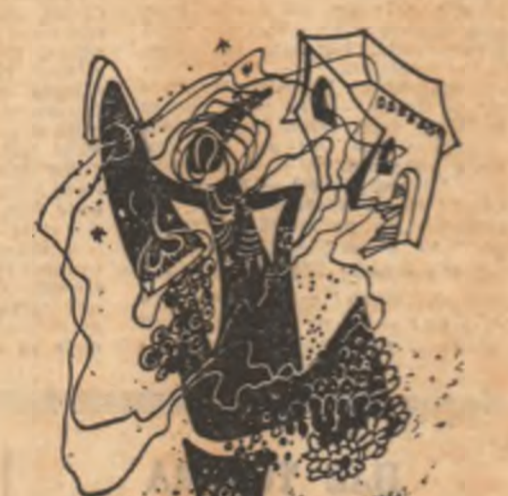
Ilustrații de VERA HARITON

Dar într-o zi, după atîta timp de liniște netulburată, regele simți o nedumerire în cugetul său. El vedea lumea din juru-i ca și mai înaltele. Magii erau aceeași, aceiași erau și palatul și Tigru și stelele. Chiar și poporul îi părea la fel. Totuși el se simtea altul în mijlocul lor. Pe zi ce trecea, amintirile lui se pierdeau din mîntea lui, tot mai mult. O umbră se așterea peste el. Din mîntea lui multe, din dipele trăite atîtdată se ștergeau și dispareau, ca și cum o mină dusmană le gonesea tot mai departe de el. La portile mîntii, alte clipe străine și necunoscute pînă atunci, băteau și puneau stăpînire pe tot cugetul.