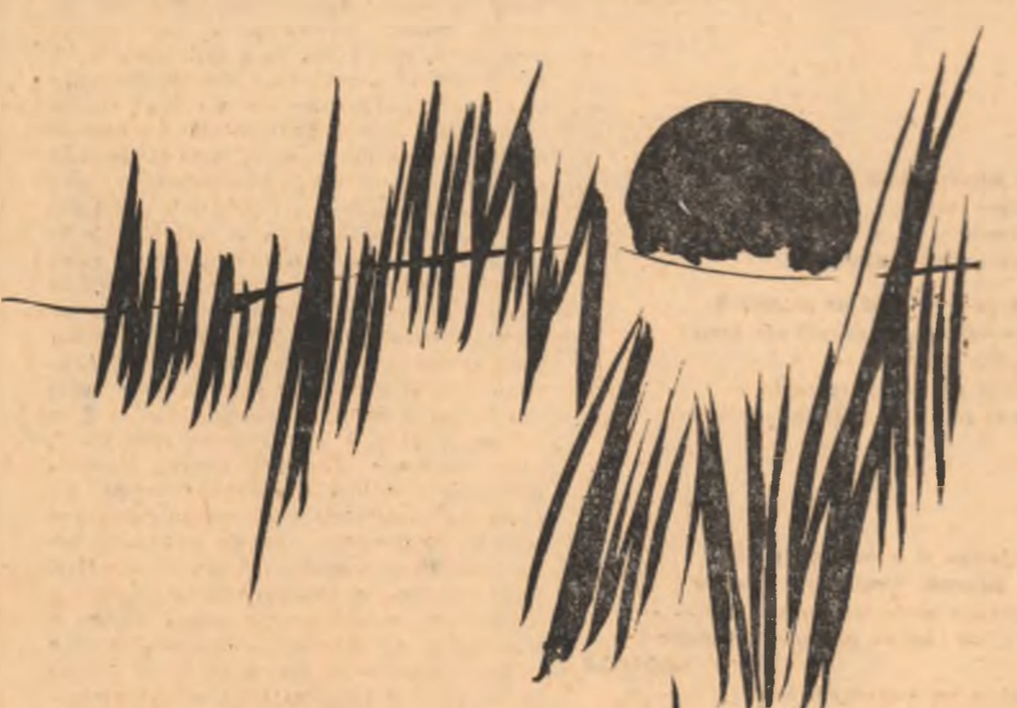
Desene de COSTEL E. DRAGAN

— Ce-a vrut să spună ăla? m-a întrebato Moise, care era cu mine. — Cine? — Aia, cu mortul... — Niciodată nu-i mai zisese ăla și cu glasul ăsta lui Dunărințu. — N-am înțeles. — Nici eu, a zis el. Nu era cine știe ce de înțeles: nu voia el să recunoască față de mine c-a înțeles. Sau mă pune la încercare de-am înțeles eu? — Cred că era beat, i-am zis.