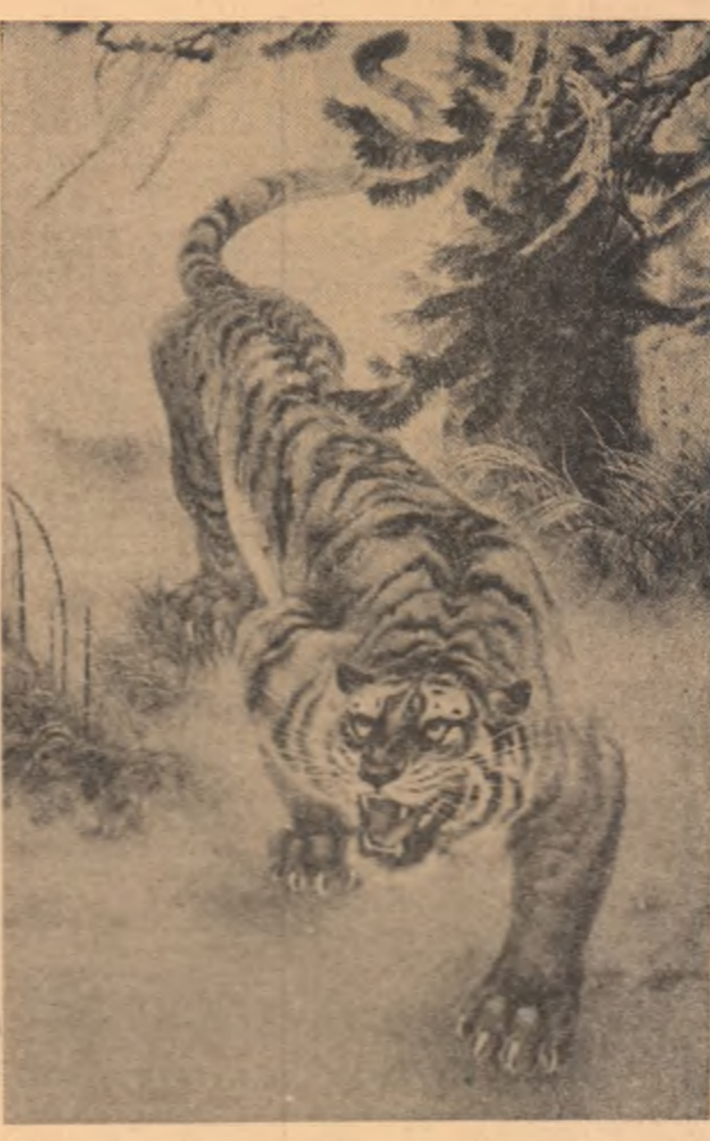
LI VON IN : „Tigul” (Broderie)