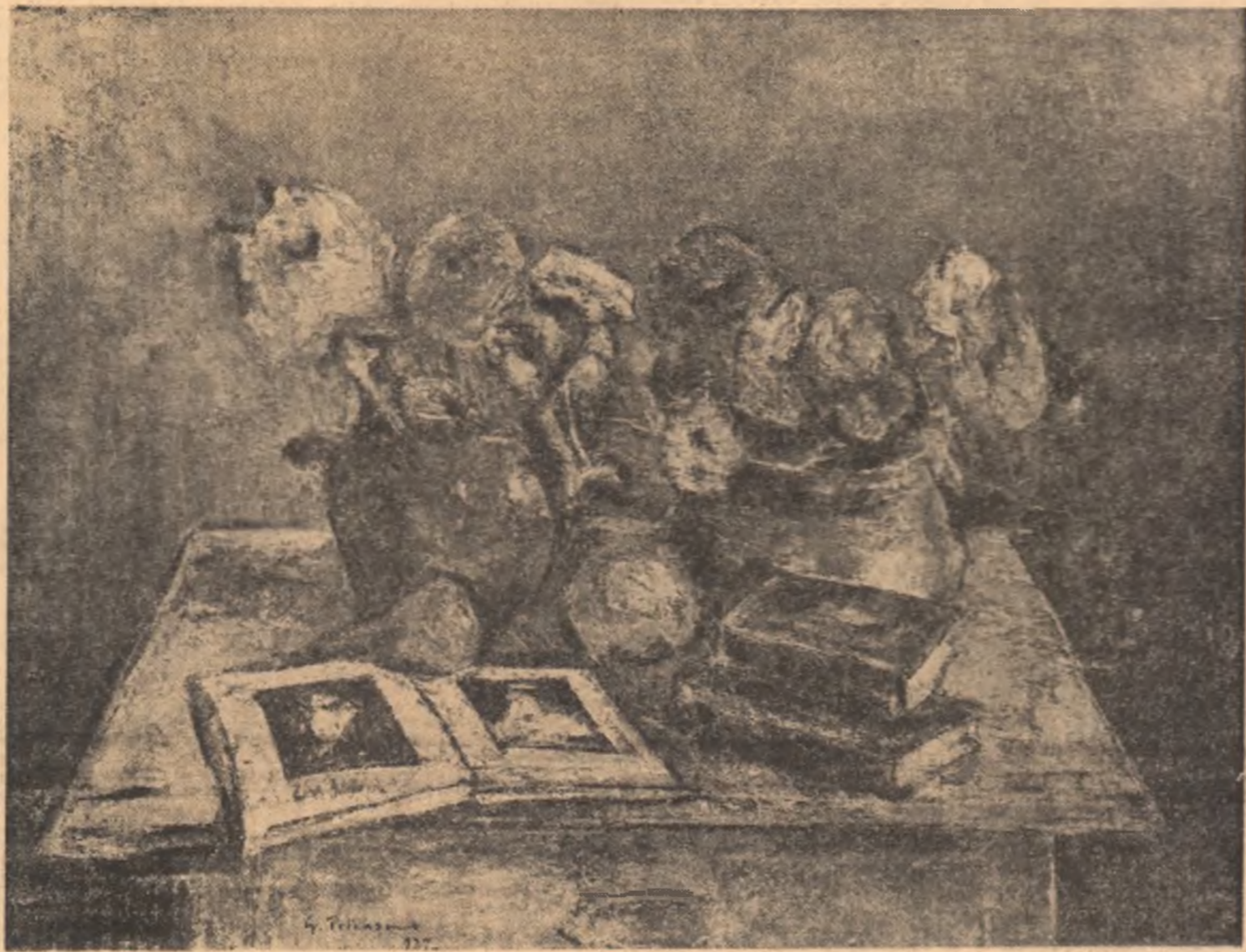
Ulei de GH. PETRAȘCU