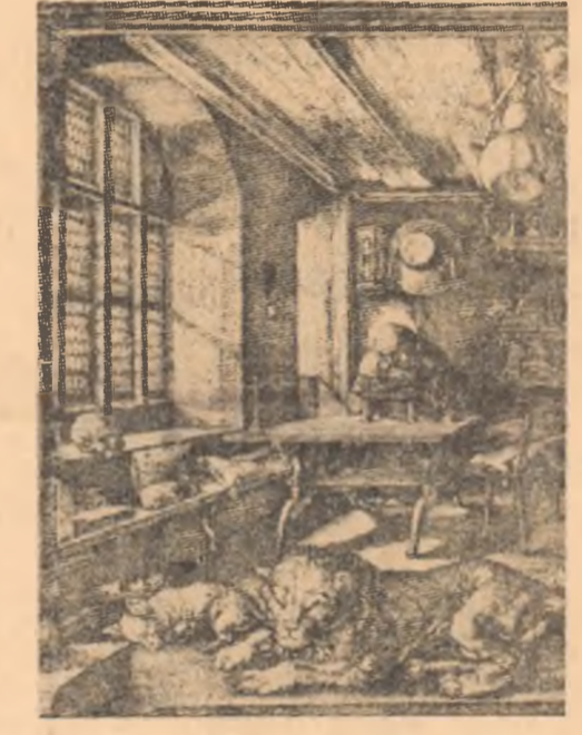
A. DORER: Gravură pe cupru

„N-are să-ți vină să crezi, dar Schoenberg a descărcat încă o salvă împotriva noastră...”