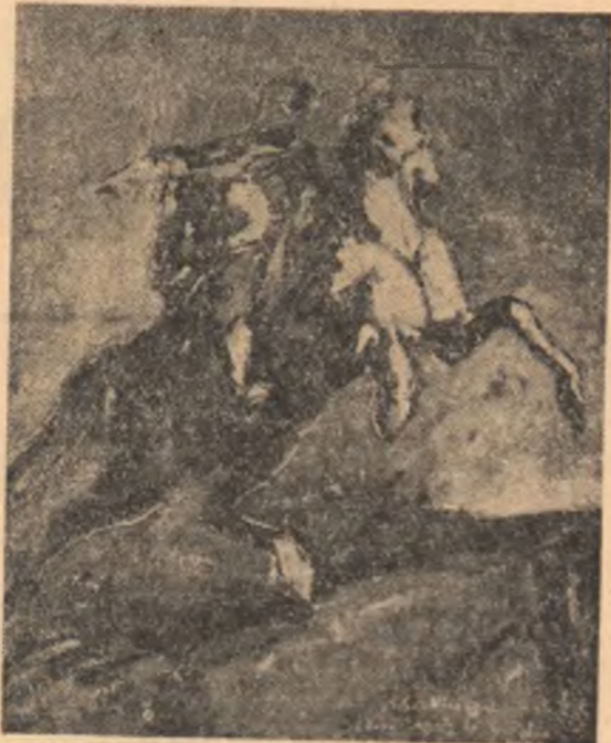
GH. PETRASCU: „Mihai Viteazul”