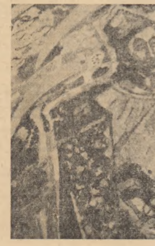
BRĂDUT COVALLIU: Avram Iancu

În sfîrșit, dar nu și în cele din urmă, voi semn, începînd din martie, cronica literară a „Vieții românești”, (despre cărțile de critică), ceea ce implică bineînțeles pentru mine un angajament și mai activ față de valorile literaturii noastre contemporane.