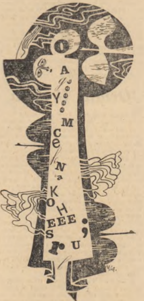
Desene de MIHAI GHEORGHE

Eram în această vară la Caraorman, eram odată de secețea rare micile grădini ale satului. Fîntînile erau uscate și rare. Canalul, care în timpul inundațiilor devine fluviu, s-a strîns și s-a depărtat cu cîțiva kilometri de sat.