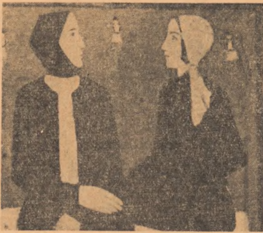
ION PACEA: Femei discutînd

În privința literaturii lirice, cred că — în linii generale — clasificarea de mai sus rămîne pe deplin valabilă; există, pe de o parte, o „poezie a cetății” (Eugen Jebeleanu, Adrian Păunescu,