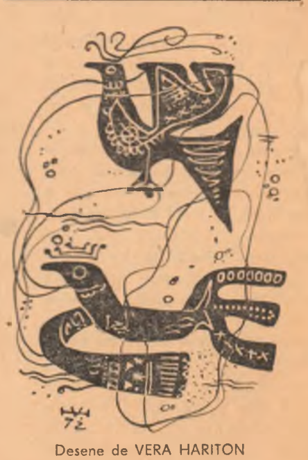
Desene de VERA HARITON