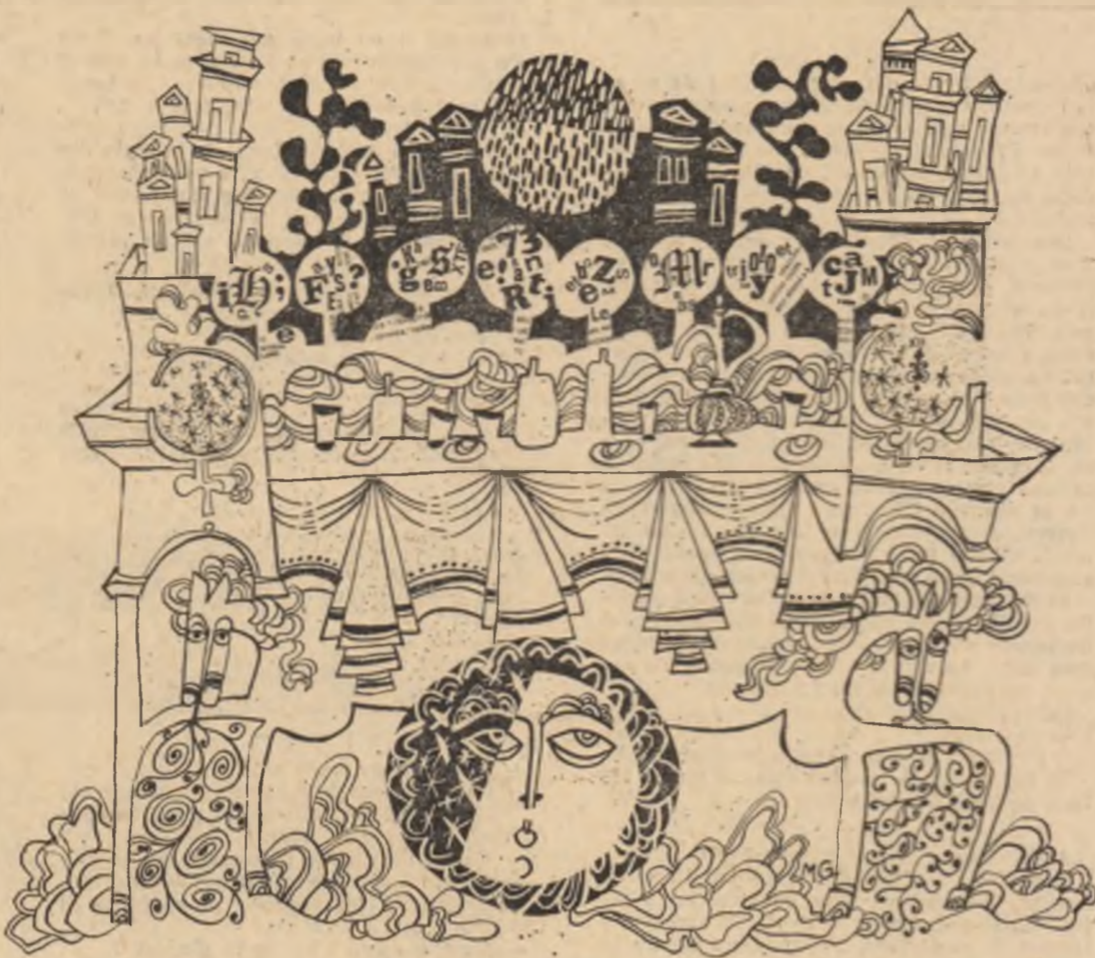
Desen. de MIHAI GHEORGHE

Iată, ziua de Mai luminează ca o cetate subțire de miere. Cerul se poate atînge cu fruntea. Și vine noaptea și-n orbitele ei strălucesc semne de aur. Patria-i instelată ca ziua de Mai. Pe gura poetului cad aripi.