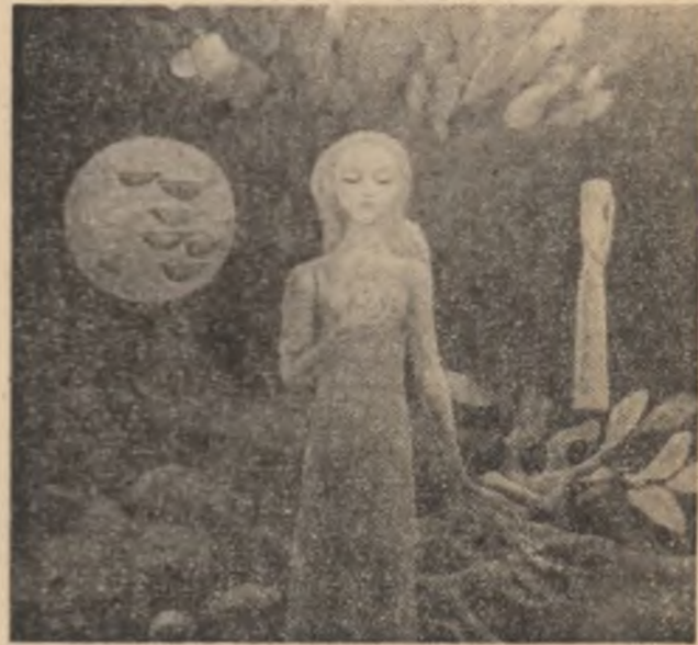
SABIN BALAŞA: Maternitate