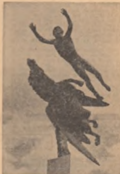
CARL MILLES : Pegasus

Ascult ciripitul păsării galbene acum, adineaori, o clipă care și-a pierdut înțelesul