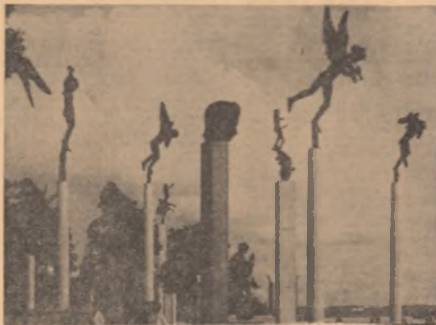
CARL MILLES : Grup statuar (Parcul Carl Milles, așezat pe țărmul insulei Lidingö, lângă Stockholm)