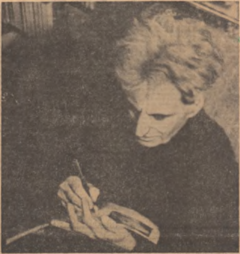
Se împlinec, la 12 martie, 8 ani de la moartea lui G. Călinescu, pierdere ireparabilă a culturii române. Feste la genul lui G. Călinescu a lăsat dări mari de lumină: în istoria și critica literară punctele de reper pe care le-a fixat constituie un fundament pentru orice cercetare ulterioară; în romanul prospectivă lui în universul tragicului și al dilemelor intelectuale a creat un etalon de substanțiatitate. Ca artist cetățean G. Călinescu a arătat celea metamorfozele: bărbatul care petrecea în singurătate „ca vulturul pleșur pilit în stinca rece”, a păturs în mijlocul mulțimii, cîntind valos din flaut. Pentru autorul Bieltulu laonide adeviziunea la revoluție, la socialism a însemnat un proces binefăcător de primenire, de animare a elanurilor spirituale, o exuberanță creatoare. Luceafărul celebrat memoria marelui dispărut publicând în pagina a 3-a articole de evocare și comentarii la un document inedit care credem că prezintă un excepțional interes.

Și echității, pentru toate acestea se zbat ceilalți, cei care nu au destule resurse pentru a comunica, fie chiar pe căi mai puțin asculte, cu divinități, cei care se luptă să ridice nivelul de trai al nostru, al tuturor, și cărora le poartă căruța, sălăruș, cămin și cărți gratuite pentru copiii pe care îi procrează atunci când harul divin, fiind solicitat din cele eterne, nu coboară asupra ta acaparându-te complet.