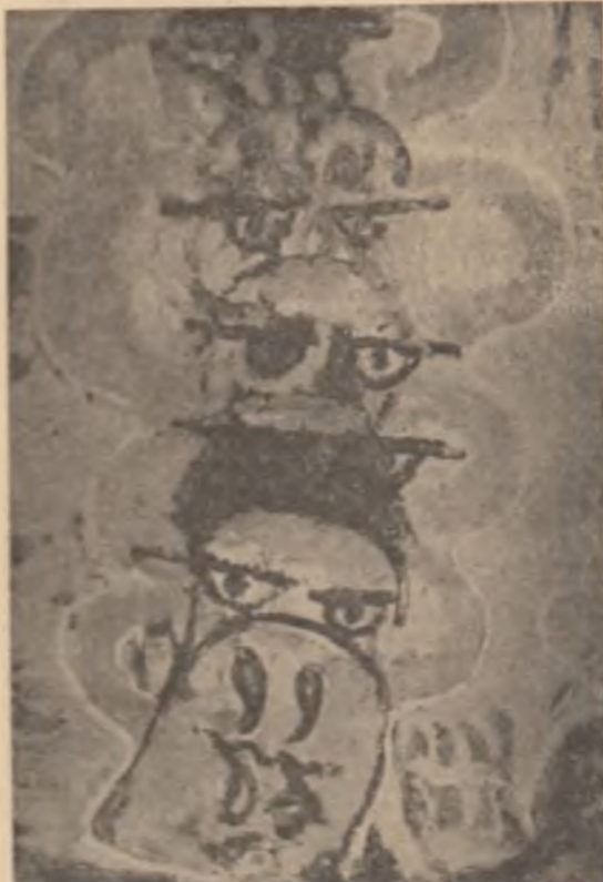
ION JUULESCU: Totem solar