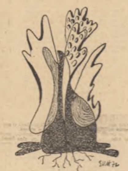
Desene de ELENA URDAREANU-HERȚA

— Da... sigur, atunci? ! zise automat Nicolae vrînd parcă să-i vină în ajutorul Emiliei, întorcînd capul spre Matei, crezînd că și el va spune ceva, răsușcîndu-i apoi spre Morțun, sperînd că cel puțin el va interveni.