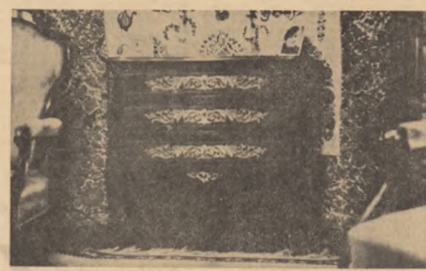
Scriinul negru aflat în casa G. Călinescu

31 august (pe contrapagină): „Au jour'hui l'Allemagne est entrée en guerre contre la Pologne. Mon Dieu, ayez pitié de nous”. A-