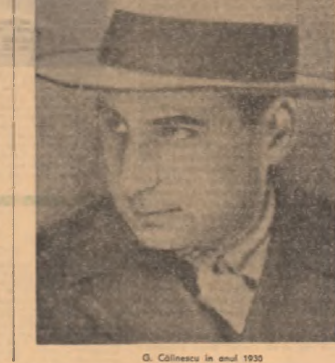
G. Călinescu în anul 1930

Lucrările au fost conduse de Fănuș Nengu, secretar adjunct al Asociației Scriitorilor din București. Viitoarea sesiune va avea loc în ziua de 18 martie a.c. la ora 18.