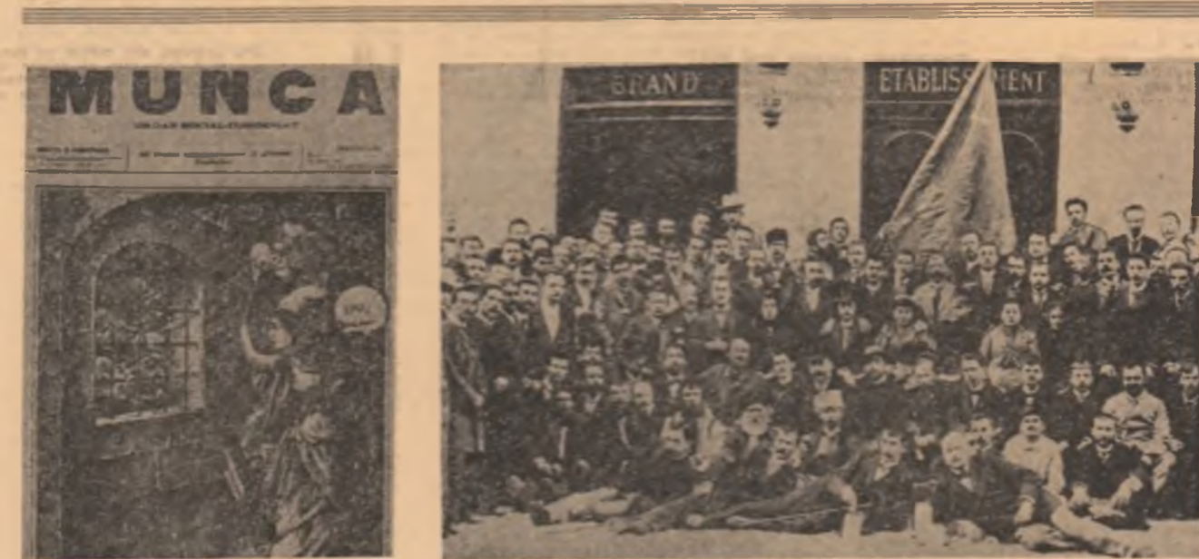
„Munca” din aprilie 1931