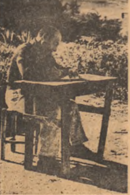
La masa de lucru, în grădina, 1956

Clapot al muncii, mi-am încercat trupul în furtună, din prima zi a existenței, faptă decisivă pentru soarta mea: