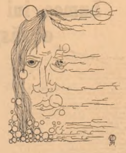
Desene de DAN MITRA

Am urmat apoi zilele triste de spital... Mircea-Horia Simionescu