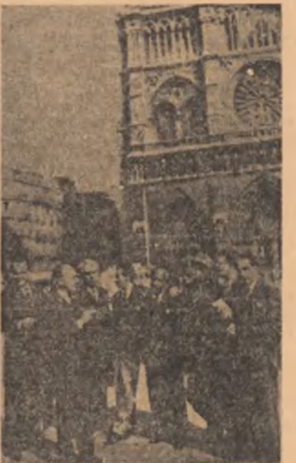
La Paris într-un grup de scriitori (1949)

Cine descoperă cine sint va descoperi și cine ești. Și pe cum, și pe încet. Am cunoscut dintr-odată toată nedreptatea. Poamea nu era numai foame, ci dimensiunea omului. Frigul, vîntul, erau de asemenea dimensiuni. A numără o suță de oameni infamești și a căsăt infumuratul. La o suță de friguri a fost îngropat Pedro. Un singur vînt a dăinuit în casa săracă. Și am învățat că gramul și centimetru, lingura și leghea măsurau lăcomia, și că omul asediat cădea repede în groapă și nu știa mai mult. Nu mai mult, și asta era locul, darul regal, lumina, viața, asta era, să suferă de frig și de foame și să n-ai încălțări și să tremura în fața judecătorului, în fața altuia, a altui ființe cu spadă sau cu candei de scris, și astfel pe brînci, săpînd și crînd, cîntînd, făcînd piine, semănînd grîu, bîgîndu-se în pămînt ca într-un întestin, învădînd fiecare cui cara cerea scinduri,