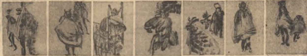
„Obiceiuri de iarnă la români” de Nicăpetre