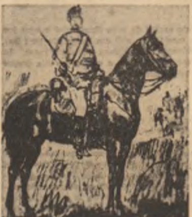
Nicolae Grigorescu: „Război călăraș”

• Ziarele românești relay o știre apărută în L'italia în leaștură cu evenimentul succesor al Sultanelui Abdul Hamid: „Dacă ar fi în de-creștea Providenției că Sultanelui actual să trebuliască ca și nenorocitul său frate Murad, a