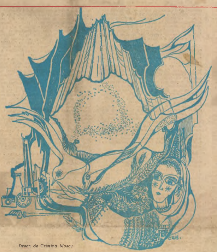
Desen de Cristina Moscu