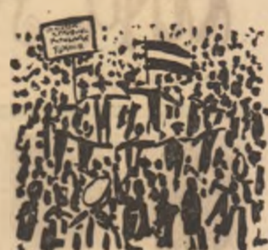
30 Decembrie 1947 — desen de Sabin Ștefănuț