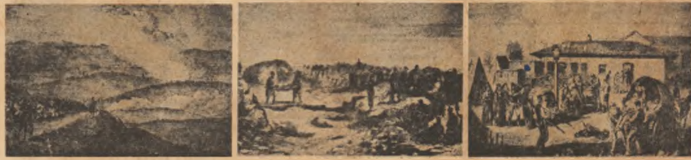
Imagini din războiul de la 1877 apărute în presa străină: Detașamentele armatei române în marș...