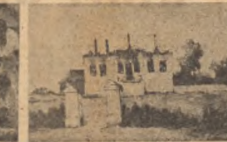
Stefan Luchian: „Canac incendiat”