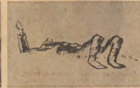
Francisc Șirato: „Mort pe cimp”