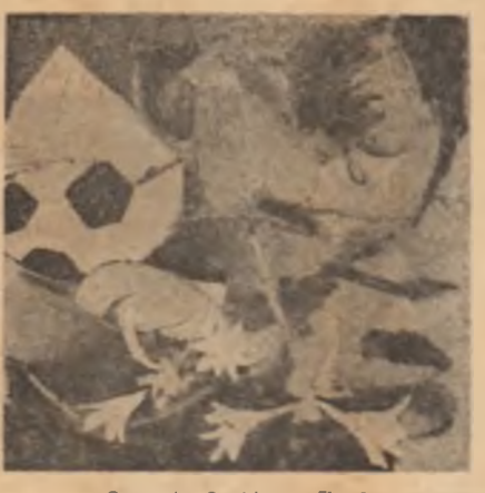
Gheorghe Spiridon: „Flon”