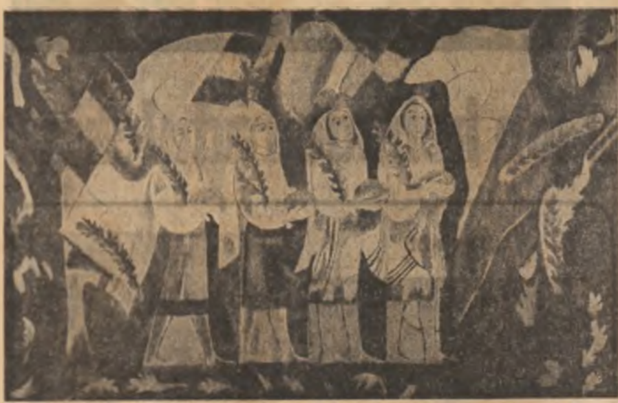
„Omagiu partidului” — tapiserie de Gheorghe Spiridon