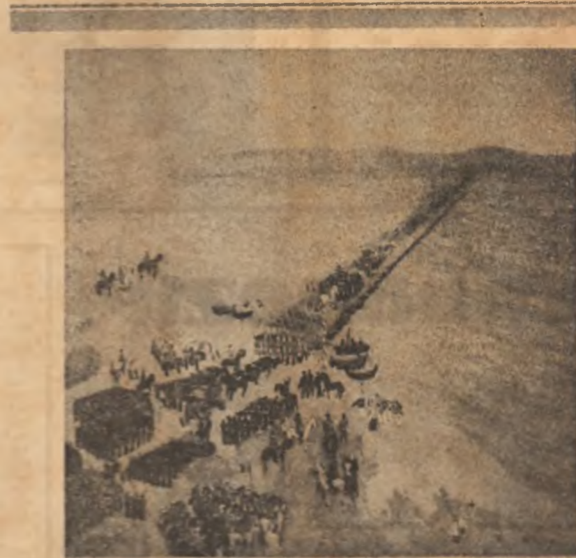
Comandant Păuș: „Trasarea oștenilor asupra păcii Dunării”