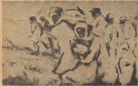
Stefan Luchian: „1907”