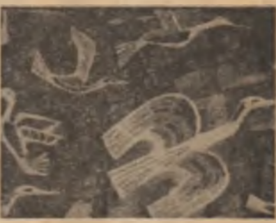
Tapiserie de Gheorghe Spiridon

apoi puteam să le topesc cu rîsulărea mea să le transform în picături de apă acum pot să-mi umplu brațele cu flori să- alerg spre tine întîmpinîndu-te.