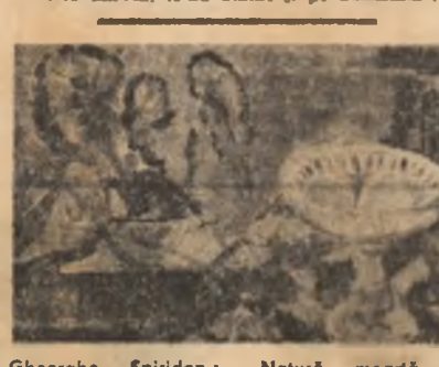
Gheorghe Spiridon: „Natură moartă cu portocale”