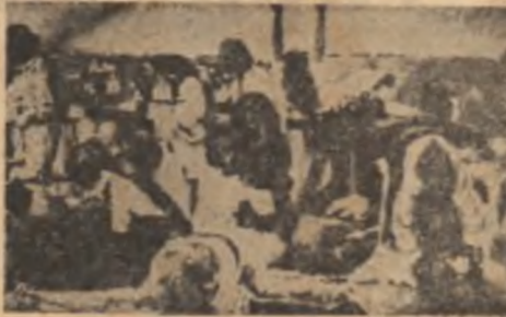
Octav Bănciță: „Înainte de 1907”