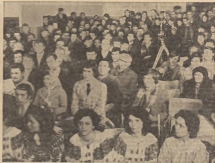
Sunt ascuțite cu omagiu, cu atenție poezia și cîntecul patriotic, aduse aici, în Bărdagan drept omagiu pentru cinsta și hîrnicia

Din țara bogată-n poeme Eroi de legendă vorbesc Și-i țara plîmădată de cîntec, De suflet și grîi românece.