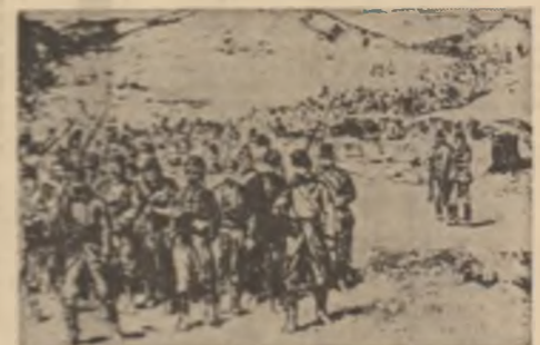
De străji la Dealul. Reproducerea din ziarul 'Războiul'...