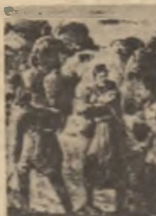
De străji la Dealul. Reproducerea din ziarul 'Războiul'...