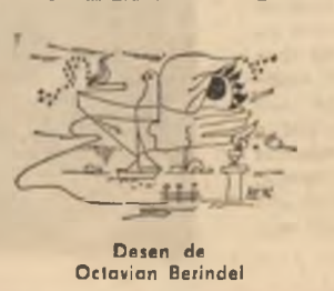
Desen de Octavian Berindel