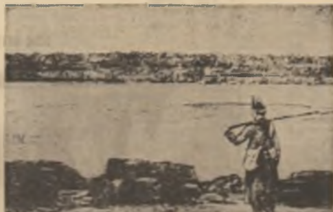
De străji la Dealul. Reproducerea din ziarul 'Războiul'...