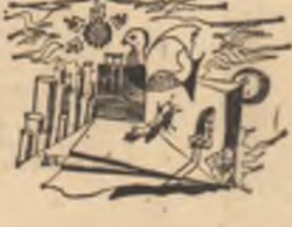
Desen de Oct. Berindil

I. V. FERIAN: Din nou, multe vorbe goale, înșirate într-o inerie convențională, care n-are nimic de-a face cu poezia (ce vrei să spunei, de pildă, cu această formulă deplin opacă, lipsită de orice substanță, „suzul bolnav de amiezii”?).