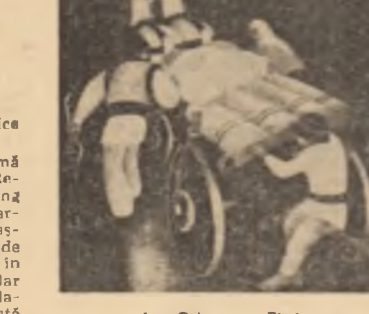
Ion Gîgoreș, „Zi de toamnă”