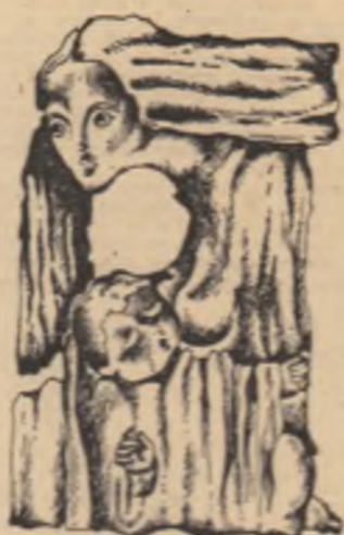
Desene de Mihaela Istroie

printre degete și Speranța plecase pentru douășpe ore. Degeram intr-un melc lingă o imagină flintînd de vid.