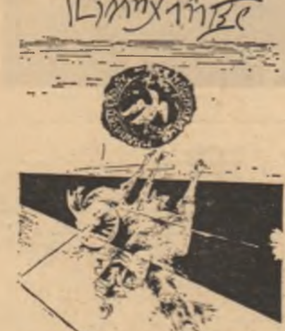
„Peștele lui Mihai Vodă”

„Lă vedea parca pe Mancaș la pauza de prinz chemîndu-l și zicîndu-i: „Măi, băiete!” și apoi: „pauză și iar... mă, băiete!” cum e, mă, înșurat, him?” „Da Lică văzuse că nu asta voiesc să spună meșterul — și asta era neobșednă de clar, fiindcă se întîmplase, trecutul, trecuse, avusesse loc, în vreme ce viitorul...”