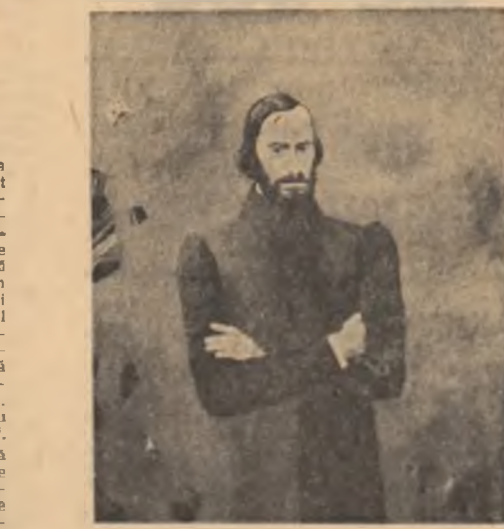
BĂLCESCU Ulei de Florin Niculău.

te care să medieze între extreme: poezia, celul, inima și ideile — într-un cuvînt celestul poetului — contrastau net cu arendășia, pămîntul cu păpăuși, borescul, starea prozai-materială — adică ferestritatea nepoetului. Este chiar structura romantică a poeziei.