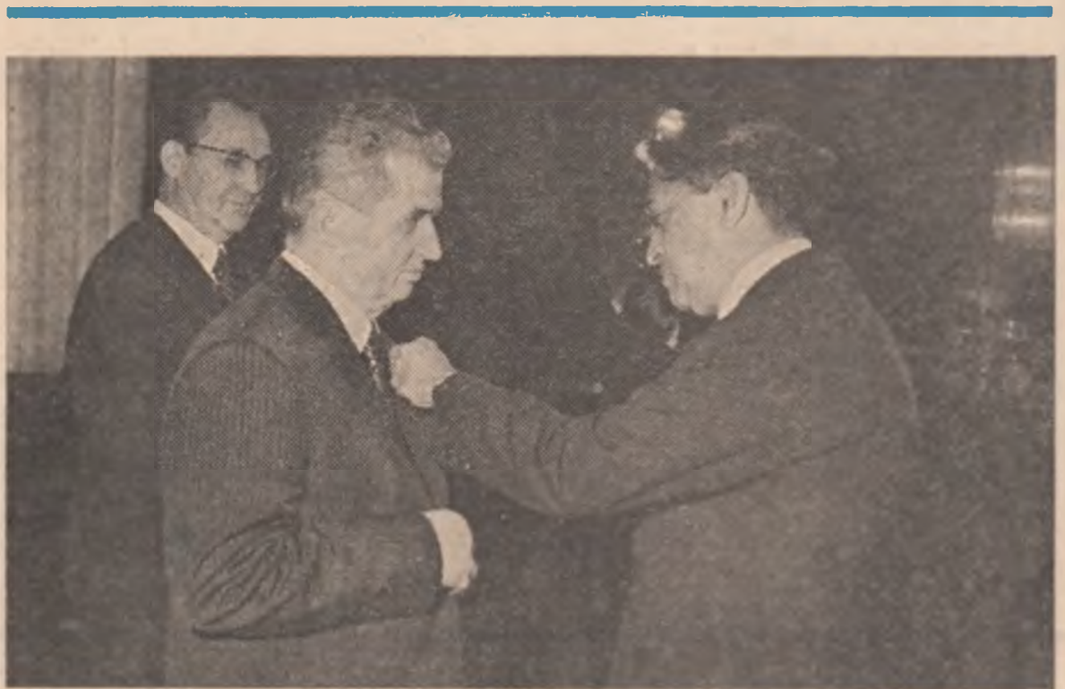
În semn de recunoaștere a eminenței sale contribuții la cauza păcii și prieteniei între popoare, președintele Nicolae Ceaușescu i-a conferit cea mai înaltă distincție a Consiliului Mondial al Păcii, Medalia de Aur „Frederic Joliot-Curie”.