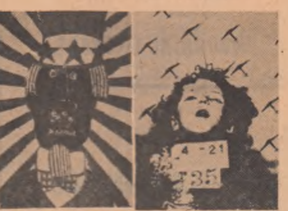
Alișul devine adeseori un protest vehement împotriva războiului