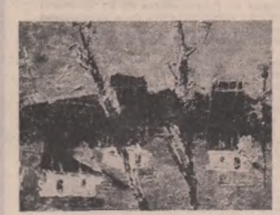
Ion Vlasiu: „Satul vechi”

o pasăre, un pește într-un peisaj marin, un iepure care moare de glonțul vînătorului ocrotit în tipătul său ridicol ca într-o aureolă: „IEPURILE CARE SI-A INVENTAT ACEL TIPĂT ca să strînească mila vînătorului — / dar nici vînătorul, nici cinele lui / n-au renunțat vreodată să-i înșafce / trupul, ca pe o mînușă de blană / caldă încă de purtare — // iepurele care n-a inventat decît un tipăt / mai puternic decît alcătuirea lui / ca să-și facă intrarea în moarte / Iepurele care nu are altă imagine / despre solemnitățile, decît sfîșietorul / ridicolul tipăt al lui...”. Cînd e vorba (am spus bine, e vorba!) de o trăire pur estetică a unei nopți cu lună la mare, cuvintele își caută o simplificare maximă, entropia lor atinge un grad excepțional: „Doamne, ce frumoasă e lumea! / Totul se poate împăca... / desi, dacă-și nota cum pe pîrtia lunii, / as ingheta, / mi s-ar zbirci lumina pe față, / pielea mi-ar scipi de moarte... / Dar, Doamne, ce frumoasă e lumea!”. Meditația poeziei în marginea unui experiment teoretic (ce-ar fi dacă ar fi?) cedează tîmrii ingenue, lăplădare a ochiului fascinat de semnul lumii, hermeneutică a seducției trupului nostru pămîntesc de către imaginea sa nocturnă, astrală și invulnerabilă, reflex de apărare a clipei în eternitate și sintagma în paradigă etc. etc..