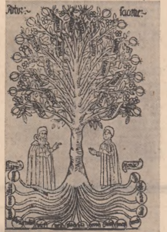
„Arborele științei” de R. Lulle (1505)