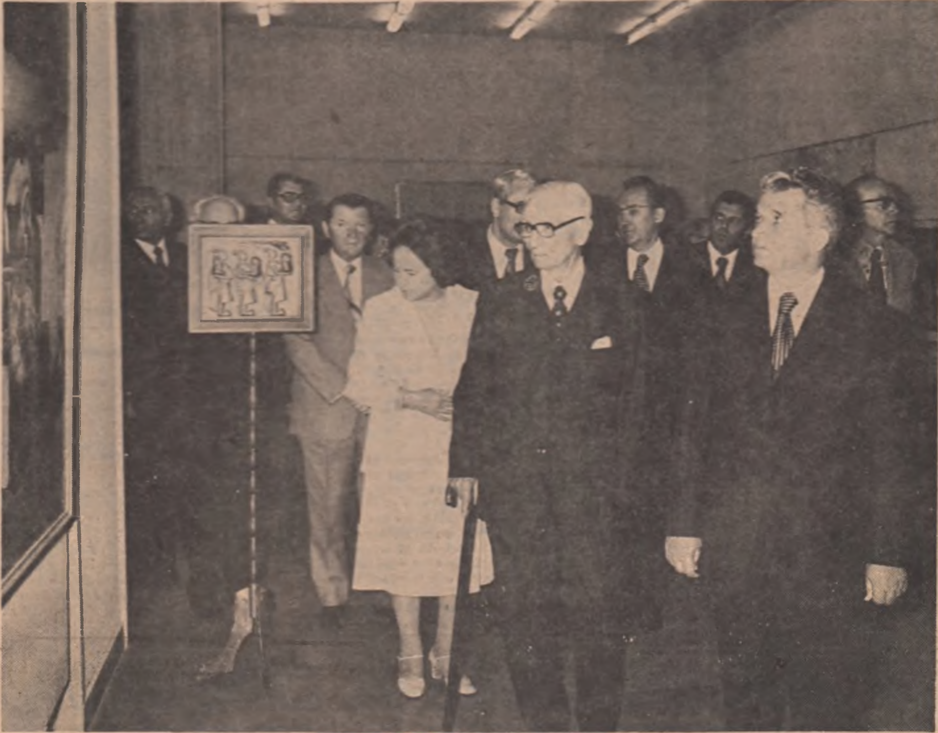
Tovarășul Nicolae Ceaușescu și tovarășa Elena Ceaușescu vizitează expoziția organizată cu prilejul Conferinței naționale a Uniunii Artiștilor Plastici

Cum și cu ce se adresează artelor decenului opt contemporanilor lor? Care sint imaginile plastice care ar putea să pătrundă, în conștiința oamenilor pentru a le înmîna speranțele spirituale? În ce zone vibrează la maximum sensibilitatea oamenilor în ziua de azi? La ce nivel trebuie să ne adresăm unor oameni care gîndesc interior cu noțiuni noi, al căror vocabular intim este net diferit nu numai de limbajul anilor '30, dar chiar de al anilor '70. Fata întrebării firești pe care le impun relațiile mereu în schimbare dintre om, societate și artă. O societate complexă impune artistului norme calitative foarte ridicate pe care acesta nu le poate trece decît printr-un continuu efort de autodepășire. Fără îndoială că artele plastice cunosc și vor cunoaște împliniri profunde și vor lăsa mustenire culturii românești opere valoroase pe care acestea le asteaptă și le merită.