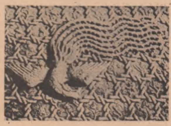
Relief de marmoră (Palatul armoniei supreme - „Tai ne dian“)

Afirmarea poezilor din generația Tang a constituit o adevărată perioadă de renaștere pentru literatura chineză. Panoramele de istorie a literaturii universale ne informează că în epoca Tang existau în China peste două mii de poeți. Rigorile unei literaturi clasice se impun în această uriașă zonă de cultură într-o perioadă, cînd poezia lirică se situează cu mult deasupra