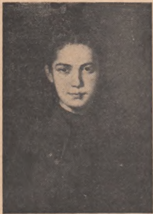
NICOLAE GRIGORESCU: „Portret de fată” (sus); ȘTEFAN LUCHIAN: „Scribiobul” (jos, stînga); N. TONITZA: „Portret de fată” (jos, dreapta)