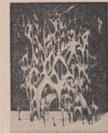
Grafică de Dumitru Ionescu

Mișcarea aceasta a minii nu-i totul Și căcă e totul imi vine să plîng Lingă un lan de secară cuprins De sudoarea și spaima că-l tai. Acum In văzduh se joacă-adevărul: mărunțul, Știut de toți și neștiut de mine Că-unte. Mai ceartă-mă cînd nu știu Fe creștet să țin un lucru pierdut: O cunună.