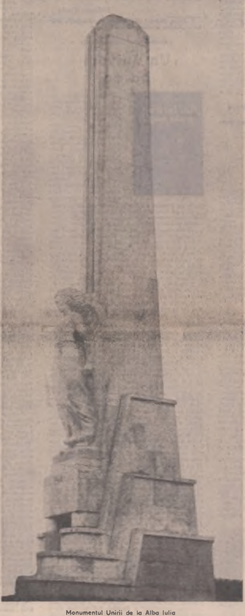
Monumentul Unirii de la Alba Iulia