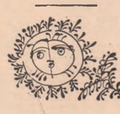
Desen de Sabin Ștefanuță