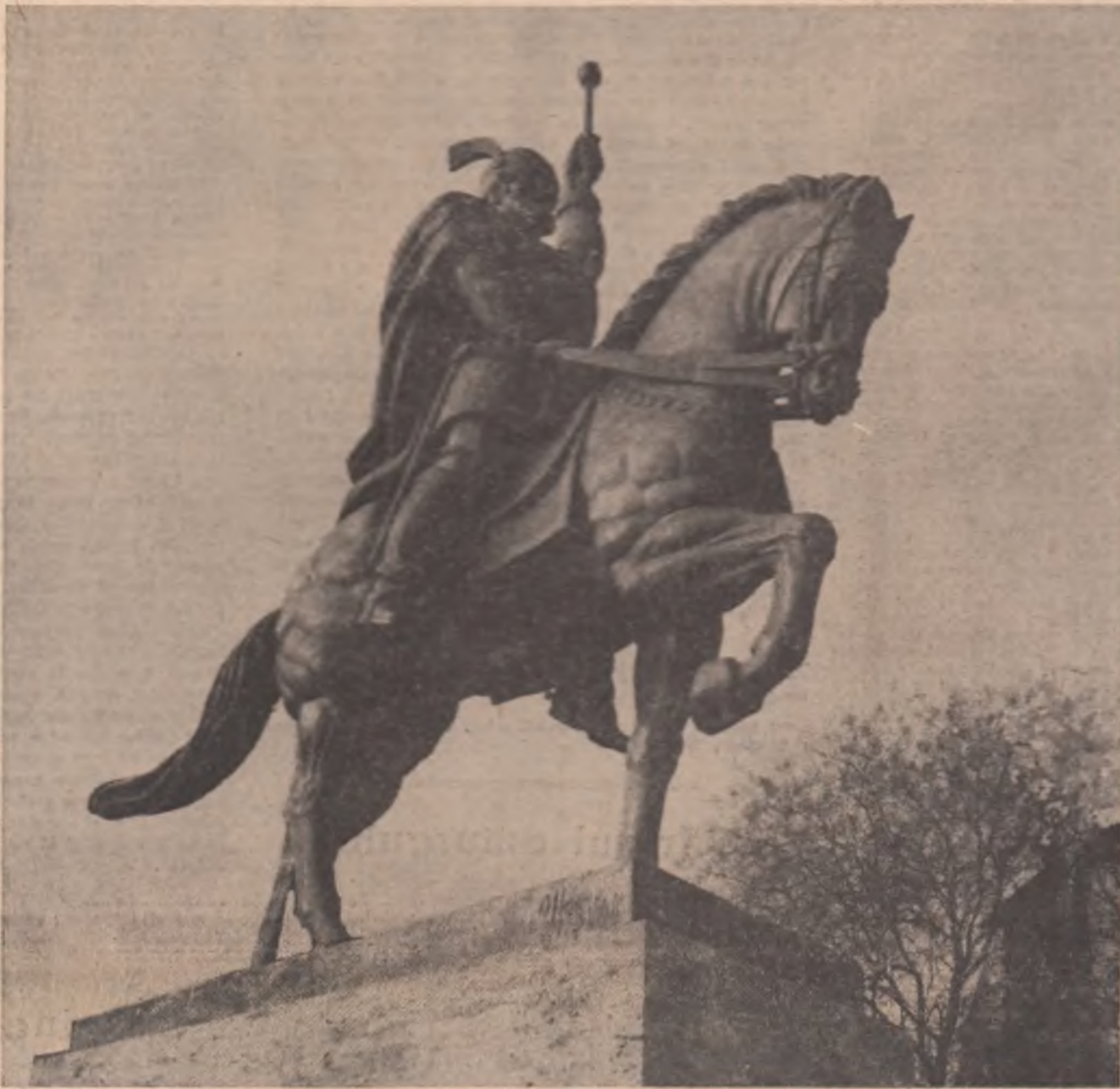
Statuia lui Mihai Viteazul de la Alba Iulia (Sculptură de Oscar Han)