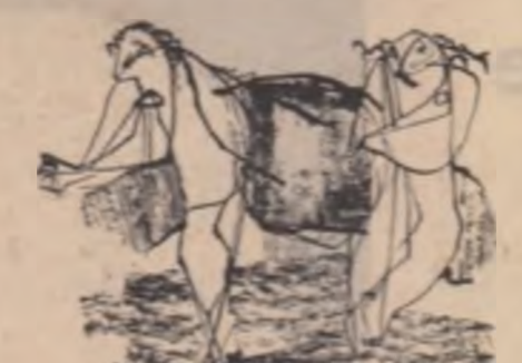
Desen de Gavrilă Ștefco