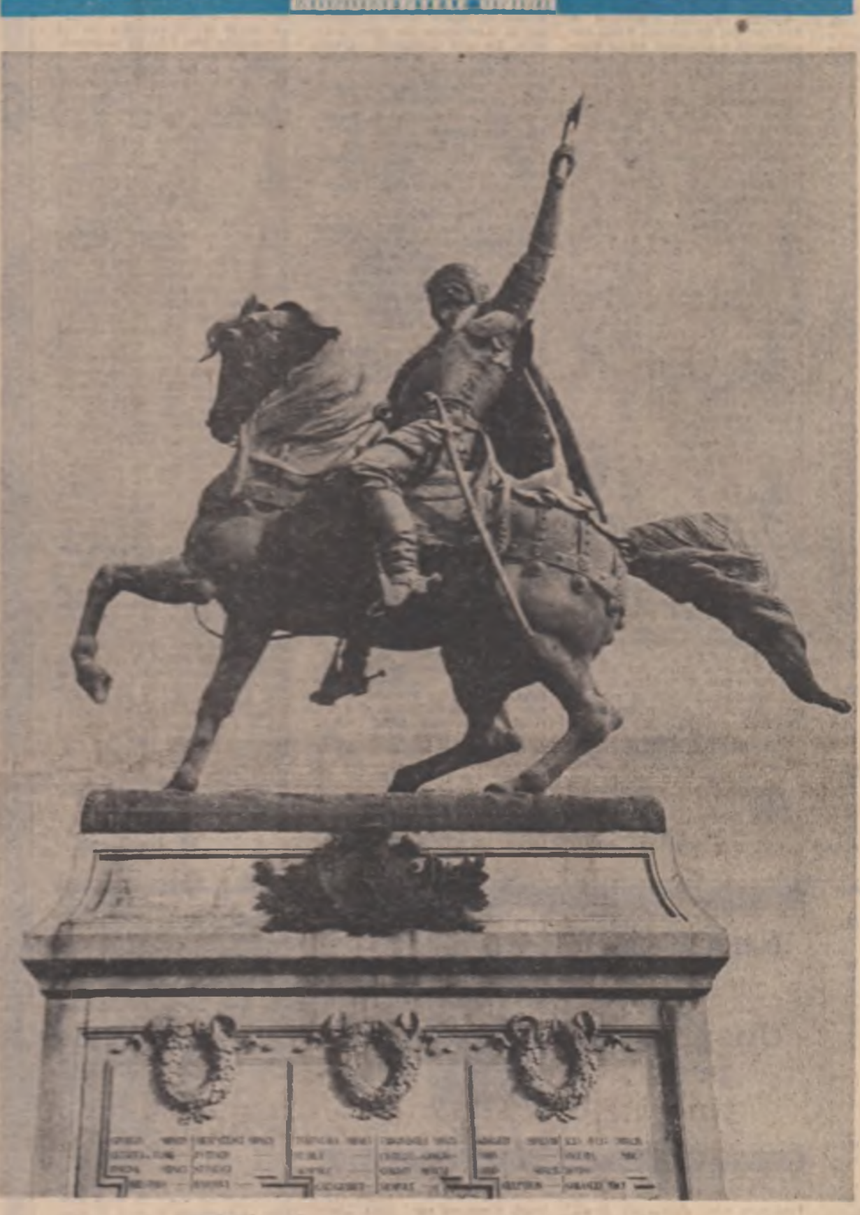
Statuia lui Mihai Viteazul ridicată în Piața Universității din București