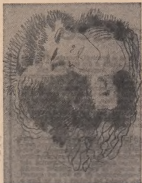
Lucia Dem. Bălăcescu: „Visul”