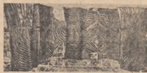
Tapiserie de Jagoda Bulc

Se îmbrățișează în vîzul lumii Săruturile de plumb Nu-i pot prinde Lega și încadra.