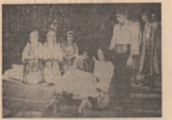
Imagine din spectacolul „Singe impur” al Teatrului Național de dramă din Belgrad